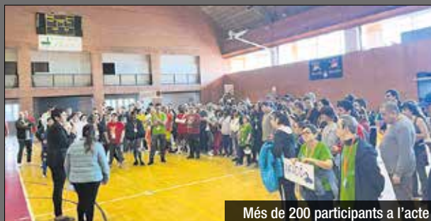
Més de 200 participants a l'acte

El passat 16 de març al poliesportiu Marina Besòs, de 9 a 14h, van tenir lloc les primeres Jornades Inclusive d'Esport, organitzades conjuntament per les entitats de persones amb diversitat funcional del municipi, Aprodisa, ASSA, BDN Capaç, Salut Mental Barcelonès Nord, Tallers Guinardó, i l'Ajuntament. En aquestes jornades, al voltant de 200 persones