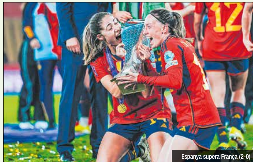
Espanya supera França (2-0)