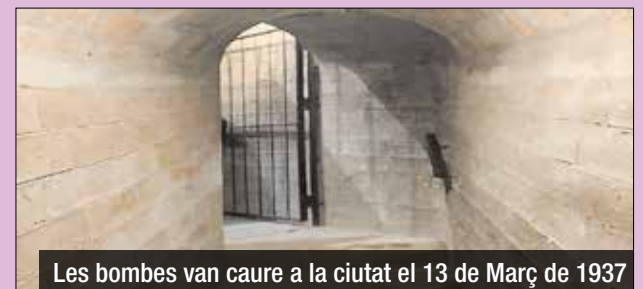
Les bombes van caure a la ciutat el 13 de Març de 1937

ha documentat a Santa Coloma de Gramenet es el 13 de Març de 1937 i no serà l'únic ja que el 29 de maig de 1937 de matinada Santa Coloma pateix 6 bombardeigs: un a les Cases Barates on hi havia la fàbrica de guerra F11 causant 9 víctimes i la destrucció de diverses Cases Barates. Un altre bombardeig afecta al costat del pont, dos a prop de l'església Major i el Cementiri Vell i dos més als voltants de la Clínica Mental.