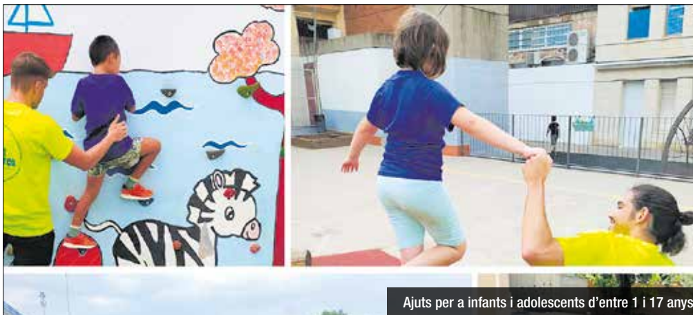
Ajuts per a infants i adolescents d'entre 1 i 17 anys

Del 8 al 26 d'abril, s'obrirà el termini per demanar els ajuts, que estan destinats als infants i adolescents d'1 a 17 anys que estiguin empadronats a Santa Coloma amb una antiguitat mínima de 18 mesos. Les beques són per poder atendre les necessitats d'aquells infants i adolescents que, per la situació familiar, no tenen les mateixes oportunitats que la resta per accedir a les activitats que s'ofereixen durant el