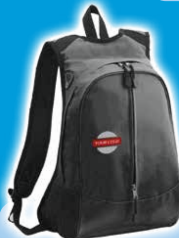
Mochila Empire - Negro Precio desde 4.2€