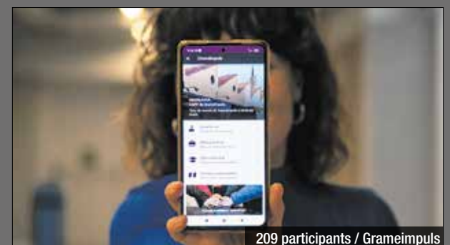
209 participants / Grameimpuls

El 78% de les persones que es formen o s'han format a la plataforma d'orientació i formació en línia els dos primers mesos de l'any són dones. Des de gener, s'han rebut 360 inscripcions i 209 persones han participat en alguna de les píncoles, itineraris, monogràfics, mòduls d'accés als certificats de professionalitat i cursos de preparació de l'ACTIC que oferim a través d'aquest recurs. La