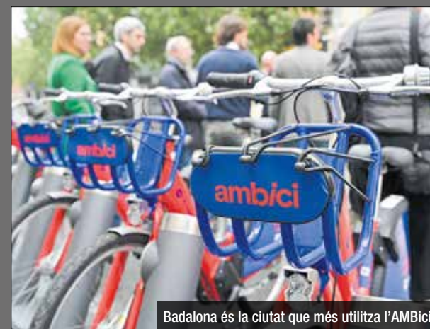
Badalona és la ciutat que més utilitza l'AMBici

El dilluns 13 de març ha començat el desmuntatge de l'antic mòdul de la Guàrdia Urbana de Badalona situat a la plaça Cameron de la Isla, al barri de Sant Roc. Des de feia temps, el mòdul presentava un estat molt