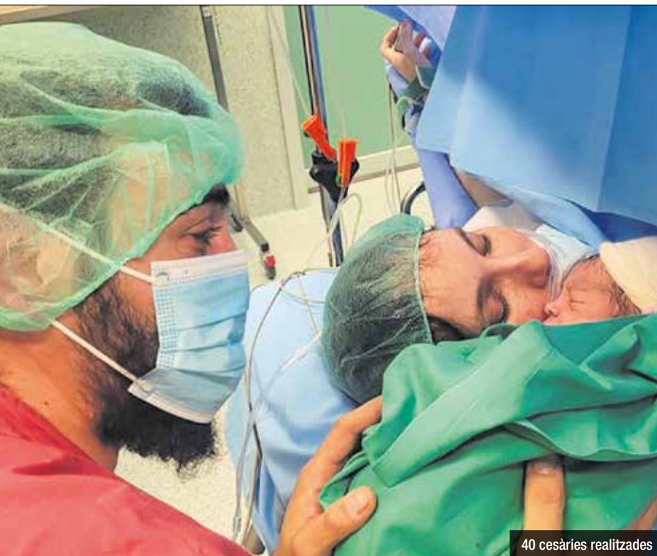
40 cesàries realitzades

Permet l'accés al quiròfan d'una persona a elecció de la dona embarassada