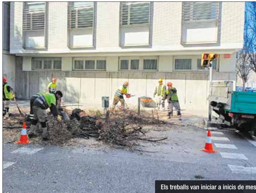
Els treballs van iniciar a inicis de mes

Per fer totes aquestes tasques, s'està utilitzant aigua freàtica. En la gestió de parcs i jardins municipals, la utilització responsable de l'aigua és essencial, especialment durant èpoques de sequera. Optar per aprofitar l'aigua freàtica emergeix com una estratègia clau per mantenir la vitalitat d'aquests espais verds. L'aigua freàtica, provinent de capes subterrànies, representa una font sostenible i resilient en comparació amb altres