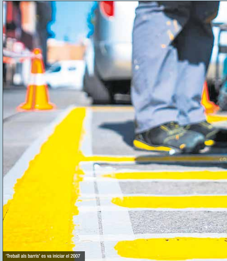
'Treball als barris' es va iniciar el 2007

Els plans d'ocupació són programes de contractació de treballadors i treballadores en situació d'atur per a la realització d'actuacions i serveis d'interès social a Santa Coloma. El seu objectiu principal és millorar l'ocupabilitat de les colomenques i els colomencs amb més dificultats per accedir al mercat laboral. A més de les contractacions, les persones participants també realitzen un mòdul de formació relacionat amb el lloc de feina que ocuparan, en aquest cas tasques de millora a la ciutat. Aquesta acció està cofinançada pel Servei