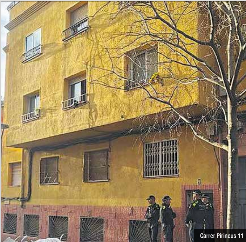
Carrer Pirineus 11

Els recursos finançaran actuacions d'atenció a les famílies en situació d'emergència