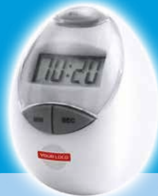
Temporizador Holly - Blanco Precio desde 1.23€