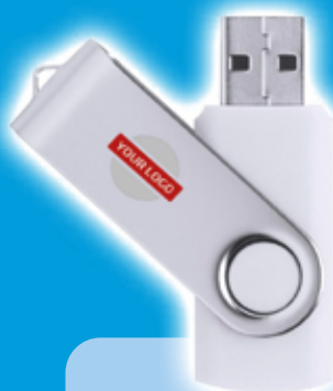
Memoria USB Yemil 32GB - Blanco Precio desde 3.2€