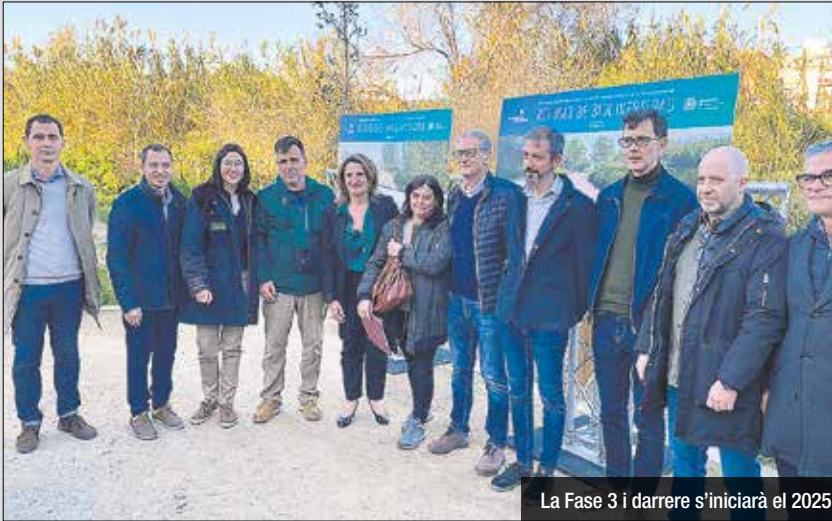
La Fase 3 i darrere s'iniciarà el 2025

S'inverteixen gairebé 6 milions al refugi com a estratègia de renaturalització