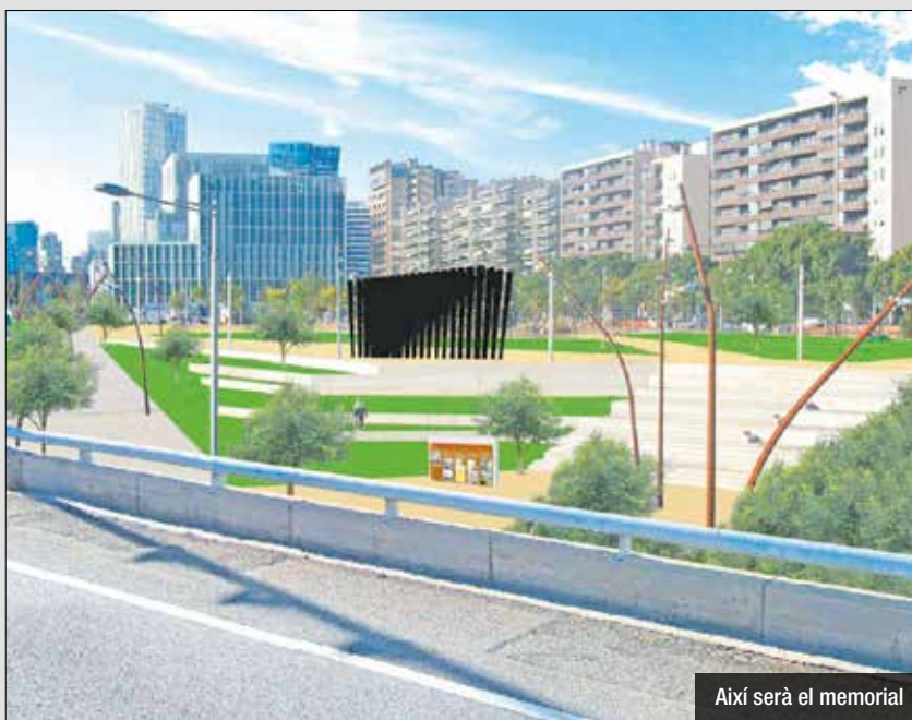
Així serà el memorial

També s'hi construirà un mur que explicarà la història dels esdeveniments ocorreguts en aquest indret, per commemorar i dignificar les 1.686 persones afusellades al Camp de la Bota entre el 1939 i el 1953.