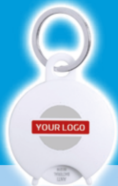
Llavero Moneda Antibac- teriano Portis Precio desde 0.23€