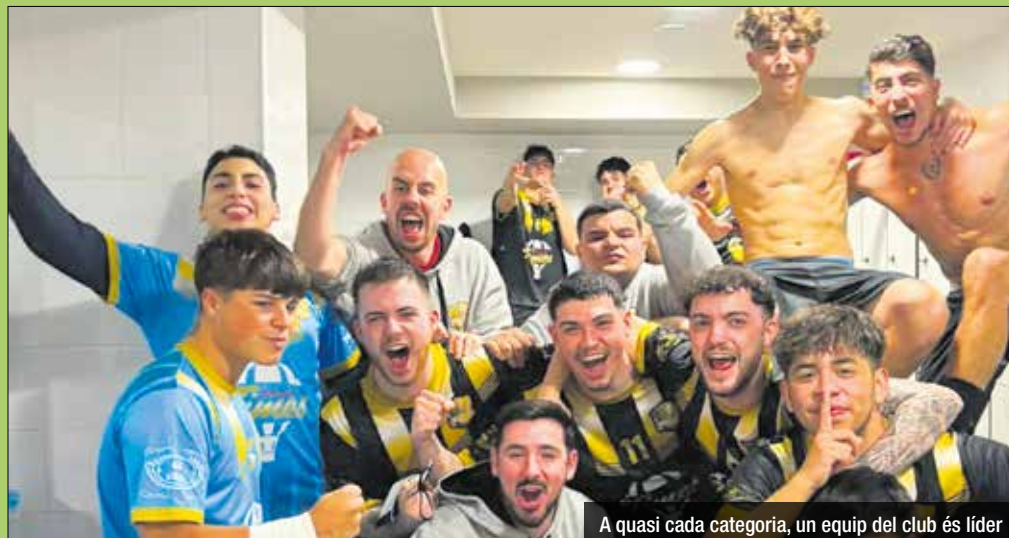
A quasi cada categoria, un equip del club és líder

Aquesta temporada, el CE Santa Coloma Futsal va iniciar el curs de competició oficial amb 12 equips, entre la primera plantilla, el futbol base i l'equip Infantil femení. Els resultats no poden ser millors, ja que una bona part de les plantilles del club lideren les seves respectives lligues. És el cas del primer equip, primer a la Tercera Divisió Catalana amb 37