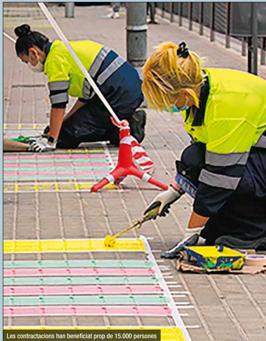
Les contractacions han beneficiat prop de 15.000 persones

Públic d'Ocupació de Catalunya i el el Ministeri de Treball i Economia Social – Servei Públic d'Ocupació Estatal, en el marc del Programa de suport als territoris amb majors necessitats de reequilibri territorial i social, «Treball als barris».