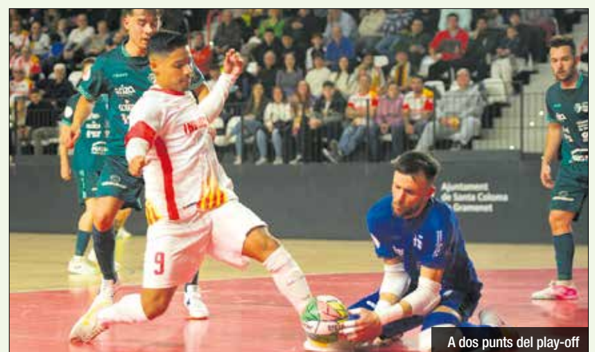
A dos punts del play-off