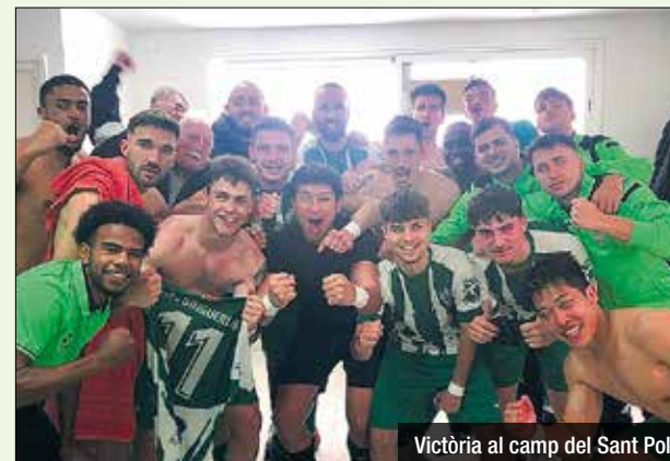
Victòria al camp del Sant Pol

El Singuerlín aconsegueix la seva vuitena victòria consecutiva a la Segona Catalana, després d'imposar-se per 0 a 2 al Sant Pol a la 23a jornada del campionat. Els d'Àngel Gálvez segueixen imparables a la competició després de sumar 3 punts més en un partit on el Singuerlín va ser molt superior al seu rival i fins i tot va poder