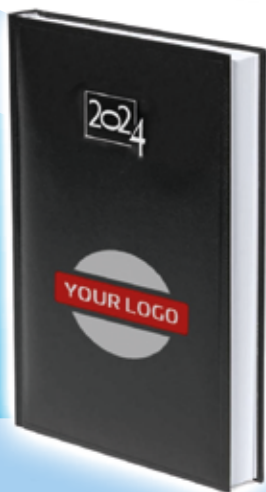
Agenda Cannes - Negro Precio desde 4.11€

Más de 20.000 productos personalizables "con un solo click"