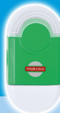
Set Cafey - Verde goma y sacapuntas Precio desde 0.52€