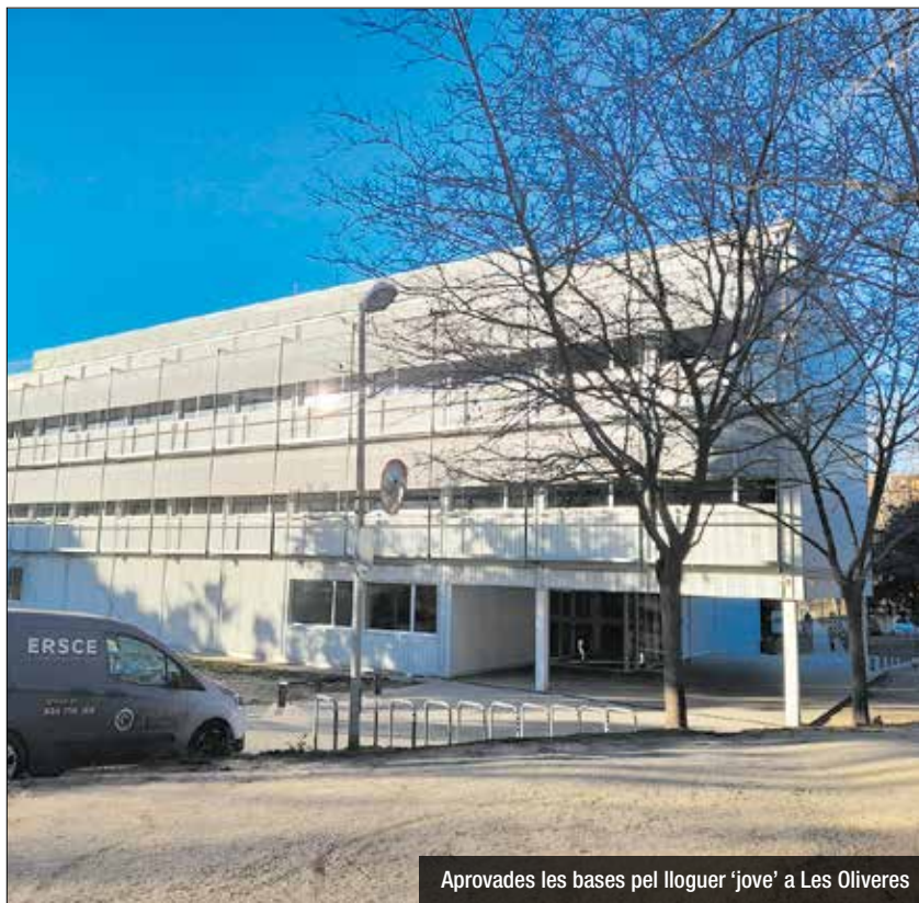
Aprovades les bases pel lloguer 'jove' a Les Oliveres

420 habitatges protegits, dels quals 271 es dedicaran a lloguer i 149 a venda