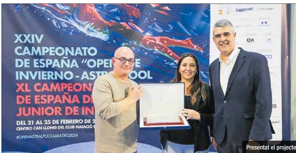
Presentat el projecte

Un any després de la seva posada en funcionament, l'AMBici, el servei de bicicleta pública metropolitana, ja ha superat els 22.000 usuaris i ha sobrepassat els 1,8 milions de viatges. Aquest servei, que és titularitat de l'AMB i està gestionat per TMB, s'ha presentat aquest dilluns, 18 de març, a Sant Adrià de Besòs, on ha començat