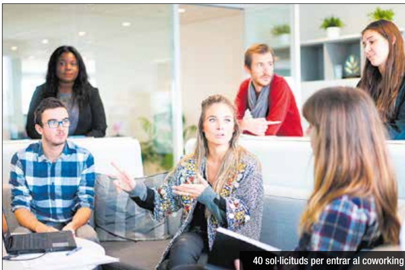
40 sol·licituds per entrar al coworking

els municipis. El tram 8, un cop enllestit, inclourà el carril bici i itineraris ciclables per connectar Santa Coloma amb Montcada i Reixac, al nord, i Sant Adrià del Besòs, al sud. Aquest tram ha rebut finançament NextGenerationEU en la segona convocatòria per a projectes que fomenten la mobilitat activa i redueixen l'ús del vehicle particular al nucli urbà.