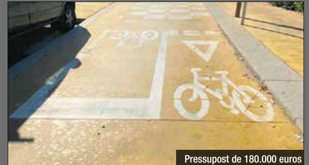
Pressupost de 180.000 euros

La Junta de Govern Local ha adjudicat les obres corresponents al projecte executiu del tram del Bicivia 8 comprès entre el parc de Can Zam i la rotonda dels Jutjats, a la 3a fase de la remodelació del passeig de la Salzedera, amb un pressupost d'adjudicació de 180.774 euros (IVA inclòs). Bicivia és la xarxa pedalable metropolitana dissenyada per l'Àrea Metropolitana de Barcelona, d'acord amb