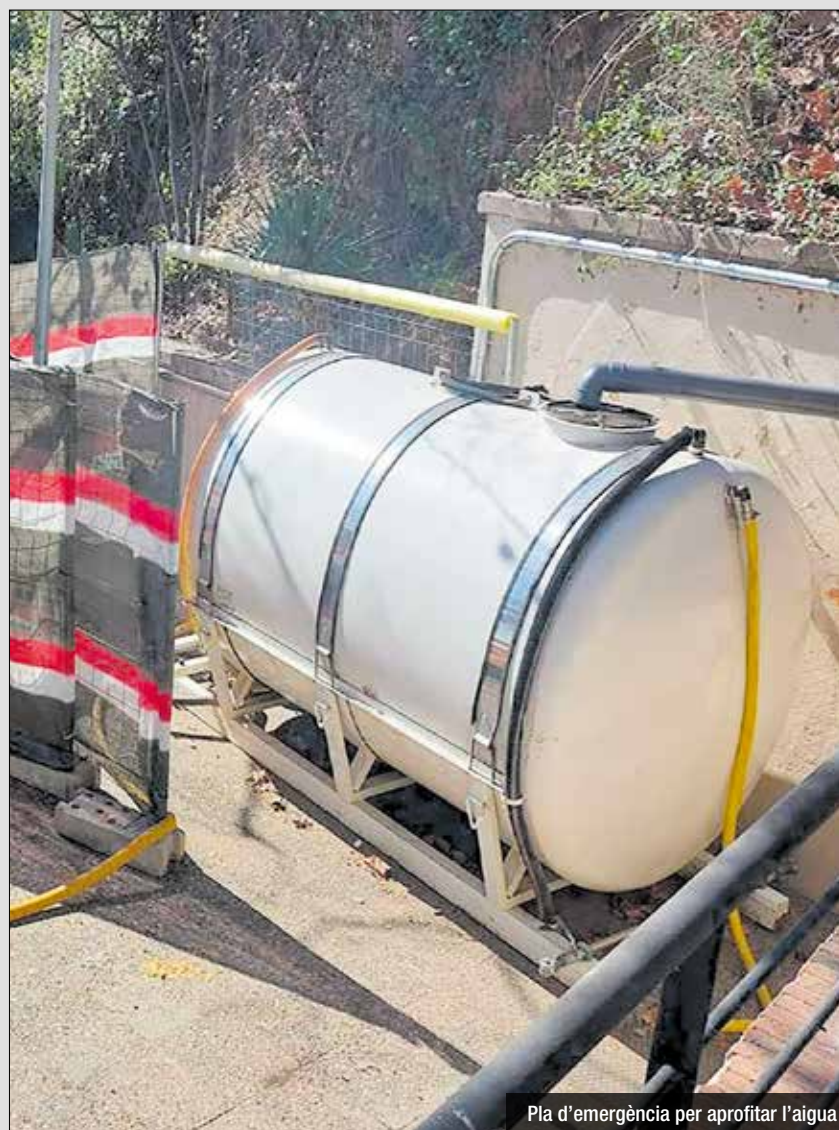
Pla d'emergència per aprofitar l'aigua

Des del mateix àmbit de Parcs i Jardins s'instal·laran dos dipòsits de 6000 litres cadascun en una tercera fase en les properes setmanes. Es treballa en col·laboració amb l'ADF per incrementar aquest aprofitament amb una cisterna complementària de 15.000 litres. A hores d'ara es duu a terme un estudi tècnic amb l'ATL per definir les properes accions a desenvolupar que permetin un millor aprofitament d'aquest recurs i una diversificació dels usos de l'aigua recuperada. Actualment, s'aprofiten uns 15.000 litres diaris i l'objectiu és arribar als 45.000 l/dia amb aquestes primeres actuacions, complint les directrius del Pla d'Emergència en situacions de Sequera de l'Ajuntament i de l'ACA.