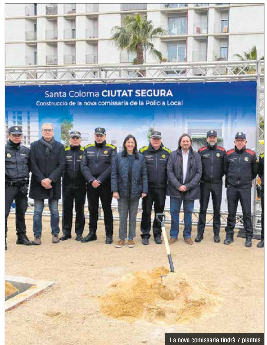
La nova comissaria tindrà 7 plantes

crement de la plantilla de la Policia Local experimentat en els últims anys. El nou edifici comptarà amb una superfície total de 6.494 m 2 , el doble que la comissaria actual, serà sostenible, gràcies a les plaques fotovoltaïques situades a la terrassa de l'edifici que produiran energia, i es distribuirà en 7 plantes dissenyades per a satisfer les necessitats actuals i futures dels i les agents de la Policia Local. La nova comissaria representa un avanç significatiu en termes de millora tecnològica, d'atenció a la ciutadana i millorarà la capacitat operativa dels i les agents de la Policia Local amb l'objectiu de continuar enfortint la seguretat dels i les col·lectius. El nou complex policial destacarà per la seva operativitat i eficiència, la qual cosa permetrà donar una resposta ràpida i coordinada davant situacions d'emergència, i integrarà les últimes novetats tecnològiques per a millorar la vigilància de carrers i places de la ciutat.