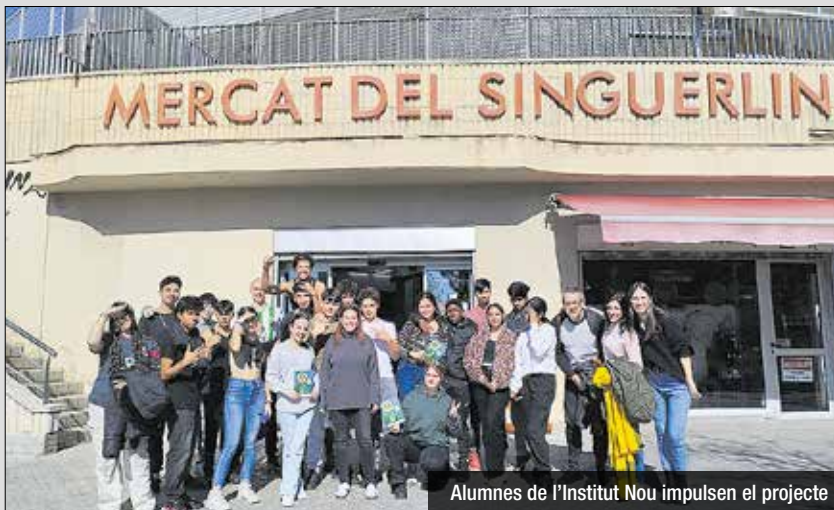
Alumnes de l'Institut Nou impulsen el projecte

La gestió de residus és una de les línies fonamentals de l'economia circular. En aquest sentit, s'ha instal·lat una màquina de precompostatge a l'Institut Nou, al barri del Singuerlín. L'alumnat recull el residu orgànic que es genera al centre, a les seves llars i es recull de la comunitat veïnal i ho diposita a la màquina. Hi ha un grup que s'encarrega del manteniment de la màquina i "té cura que es generi el precompost que s'acabarà restituint a la pagesia". "La instal·lació d'un punt de gestió descentralitzada al centre incentiva que el veïnat s'impliqui en el projecte" expliquen les tècniques. En el marc del projecte, s'han impulsat diverses accions on els estudiants han donat a conèixer la màquina entre el veïnat, comerços i el mercat, i els han engrecat a dipositar el residu orgànic.