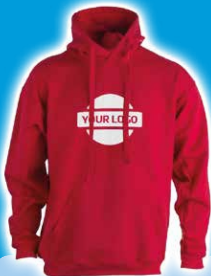
Sudadera Adulto con Capu- cha "key" SWP280 - Rojo Precio desde 12.14€