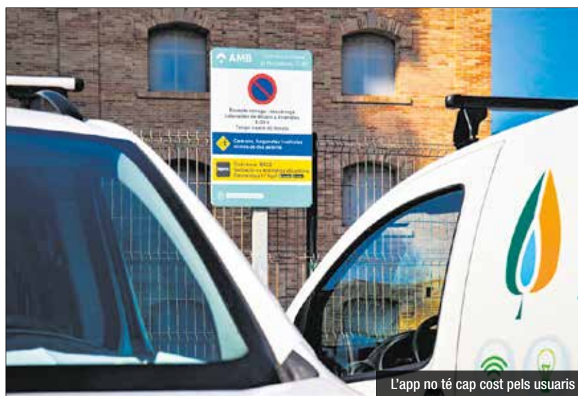
L'app no té cap cost pels usuaris