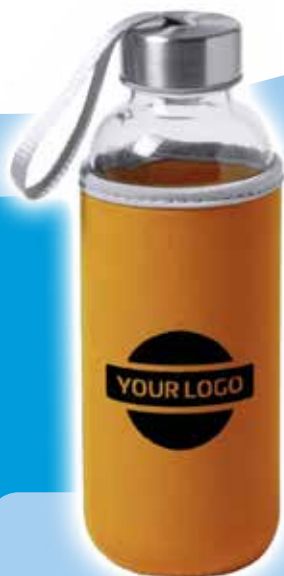
Bidón Dokath - Naranja Precio desde 1.46€