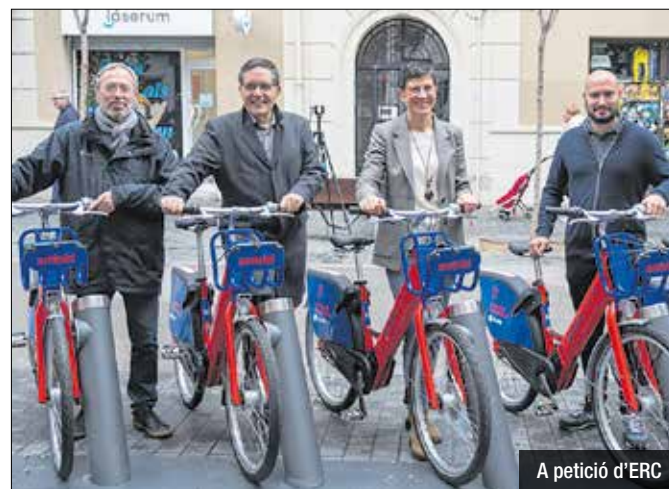
A petició d'ERC

A proposta d'ERC, el ple municipal de Sant Adrià tira endavant una moció per actualitzar el Pla de Mobilitat Urbana i Sostenible de la ciutat, desfasat i desactualitzat des del 2016. Aquesta actualització busca abordar els nous desafiaments i oportunitats en matèria de mobilitat, com ara la necessitat de reduir les emissions de CO2, promoure el transport públic i compartit, millorar la seguretat viària i el soroll del trànsit, i aprofitar les noves tecnologies com la intel·ligència artificial. A més, la moció subratlla la importància d'estratègies que fomentin la mobilitat a peu, l'incorporació d'una perspectiva feminista en l'urbanisme, i la participació ciutadana en la planificació i execució del pla