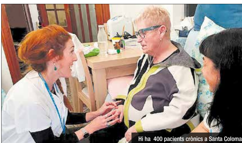
Hi ha 400 pacients crònics a Santa Coloma

Des de l'estiu passat, s'ha gestionat de manera conjunta prop de 40 sol·licituds d'incorporació al coworking de les quals el 80% han estat acceptades. El coworking enceta el seu segon semestre en funcionament mantenint la seva gratuïtat.