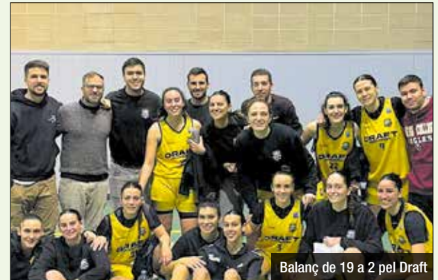
Balanc de 19 a 2 pel Draft

En els sis partits que tanquen la lliga regular, el Draft Gramenet encara s'ha d'enfrontar contra la majoria dels seus principals perseguidors al capdavant de la classificació. L'inici d'aquesta final de lliga es va donar a la pista del Roser, rival del TOP5 de la taula. I les de Santa Coloma van resoldre la situació amb solvència. Inici molt igualat, amb el Draft gaudint d'avantatges molt curts en el marcador (12-14 i 22-23). Després del descans,