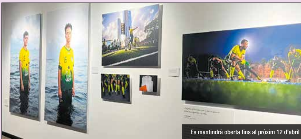
Es mantindrà oberta fins al pròxim 12 d'abril

Sota el lema «Itinerants», la Sala Riu del Centre Cívic Riu acollirà, durant el 2024, quatre noves propostes fotogràfiques que oferiran una mirada al voltant de problemes globals i les seves causes. La 15a edició de «Diaris de Viatges» començarà el proper 12 de març (19 h) amb la inauguració de «Fútbol para la esperanza», el projecte de la