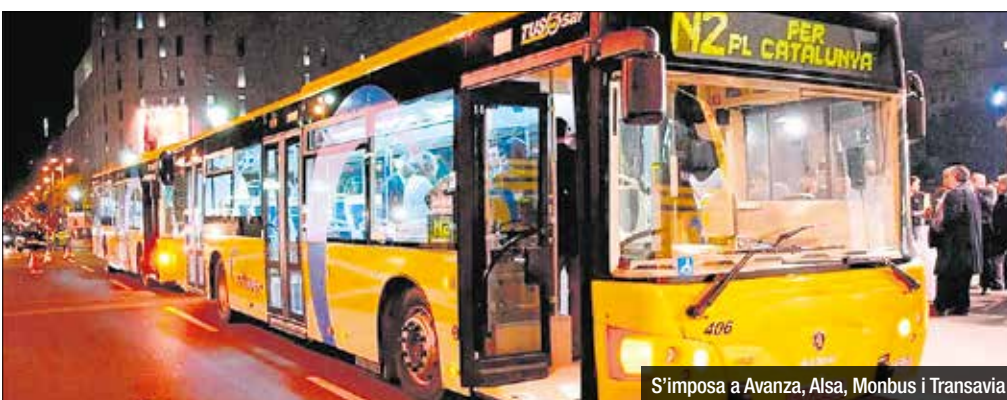
S'imposa a Avanza, Alsa, Monbus i Transavia

Tusgsal guanya la convocatòria per quedar-se amb el NitBus a l'AMB. L'empresa havia presentat la millor oferta a l'AMB per retenir l'explotació del NitBus. Segons avança Crònica Global, l'operador badaloní "ha escombrat els seus competidors, confirmant un pas de gegant per quedar-se amb l'operació del NitBus, el bus noc-