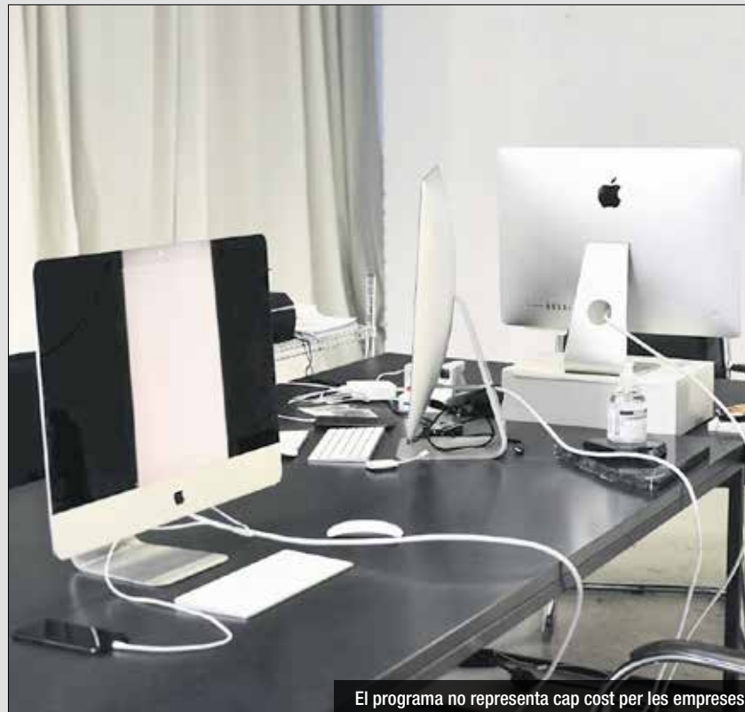
El programa no representa cap cost per les empreses

El programa no té cost per a les empreses, ja que es finança amb una subvenció de la Diputació de Barcelona, i resta obert a tots els sectors d'activitat (comerç, serveis o indústria) i mides d'empresa, des d'autònoms fins a empreses mitjanes o grans. Més informació a l'adreça electrònica empresa@sant-adria.net i al telèfon 934 620 625, extensió 9232.