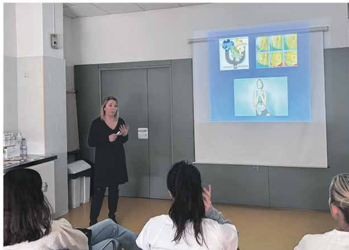
La infermera de pràctica avançada a una de les sessions formatives.

Un total de 100 professionals han participat de les sessions formatives impulsades als CAPS