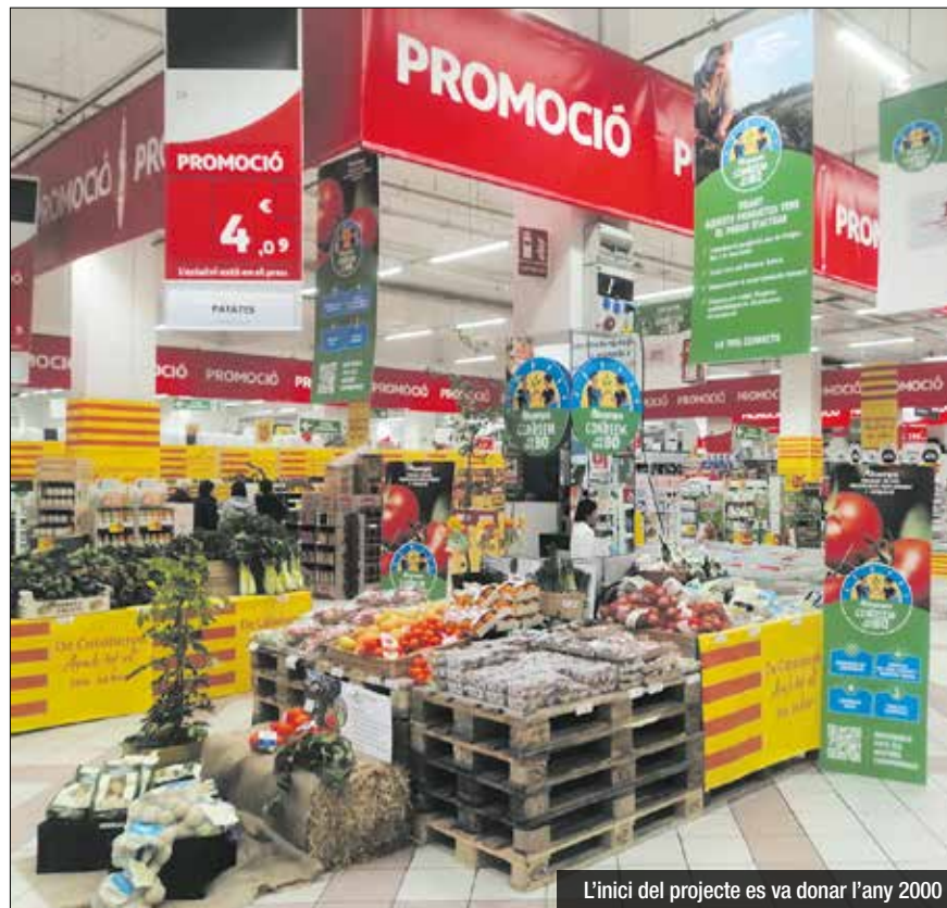
L'inici del projecte es va donar l'any 2000

La nova imatge Cultivamos lo Bueno s'anirà incorporant de mica en mica als productes ja existents, comptant amb aquesta el 20% del total, xifra que arribarà al 40% en els propers mesos amb l'objectiu d'arribar al 100% durant el 2025. Sota Cultivamos lo Bueno es poden trobar fruites i verdures, carns (pollastre, boví, porcí, oví), peixos i salaons, embotits i formatges. De la mateixa manera, també inclou alguns productes elaborats com a compotes o melmelades, entre altres.