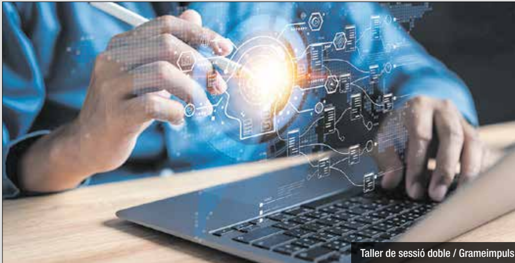
Taller de sessió doble

«Desxifrant la intel·ligència artificial per optimitzar el teu màrqueting digital» és el títol de la propera formació empresarial. El taller, de sessió doble, es va fer els dies 11 i 18 d'abril de 14:15 a 16:45 hores. L'objectiu de la formació és apropar a les persones participants la importància d'aplicar la intel·ligència artificial al màrqueting digital, per tal d'identificar les