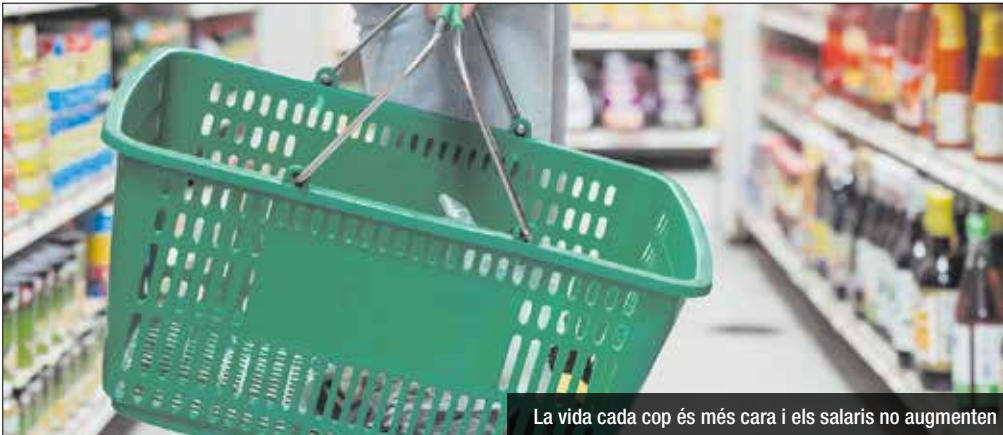
La vida cada cop és més cara i els salaris no augmenten

L'AMB calcula el salari de vida amb l'objectiu de determinar la remuneració suficient perquè una persona que treballi i la seva família puguin viure dignament. Com cada any des del 2016, l'Àrea Metropolitana de Barcelona (AMB) ha actualitzat el salari de referència metropolitana amb l'objectiu de fer visibles les variacions dels preus dels béns i serveis que componen la cistella