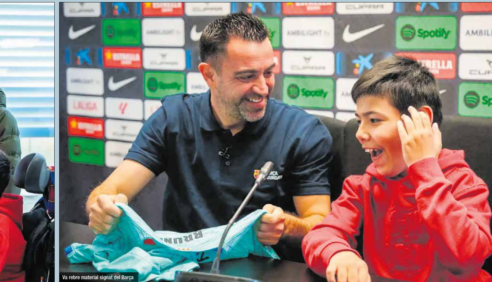
Va rebre material signat del Barça