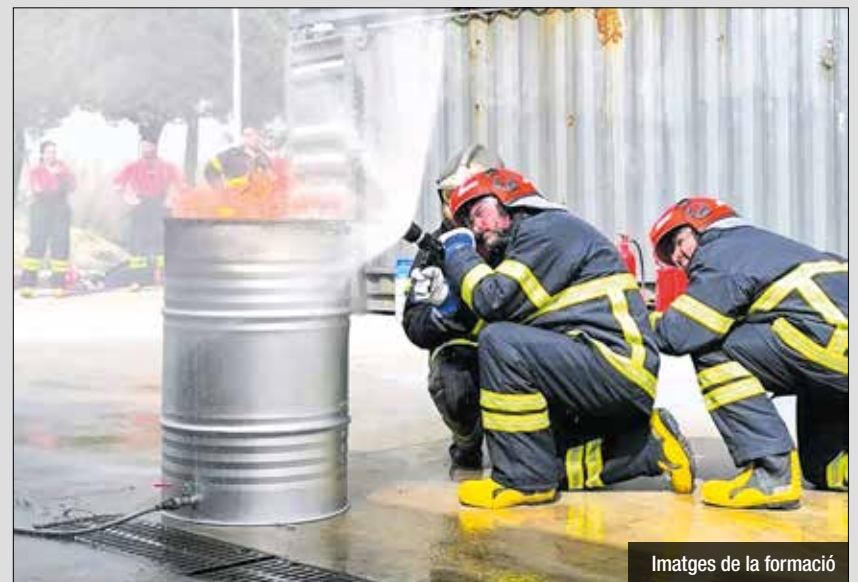
Imatges de la formació

el cos policial ha impusat les inspeccions a camions que transiten per Santa Coloma amb l'objectiu de garantir la seguretat viària i el compliment de les normatives de trànsit i transport. En un dels darrers control realitzats, tres camions van ser sancionats.