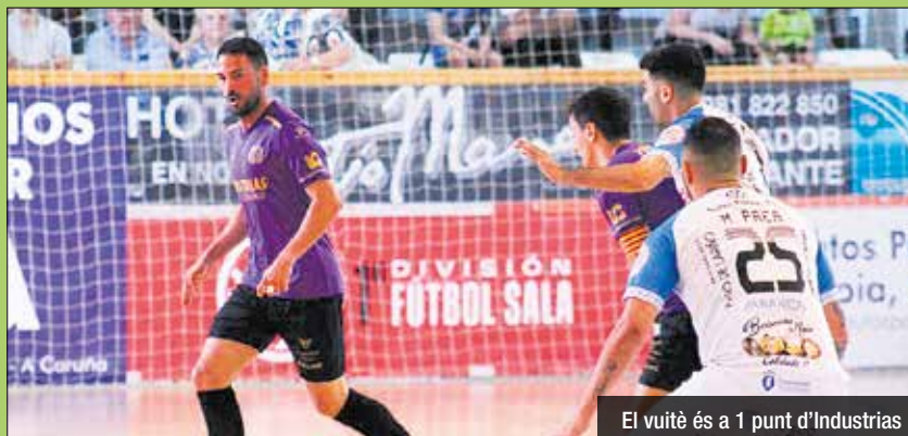
El vuitè és a 1 punt d'Industrias

Industrias és novè amb 38 punts, a 1 del play-off pel títol. Alzira, Pozo i Jaén, els últims rivals