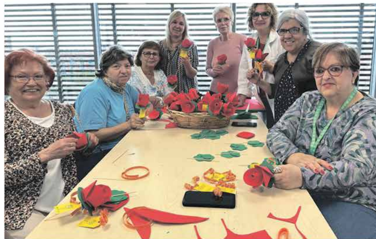
Les voluntàries de la FHES i familiars dels pacients elaborant roses manuals.

Durant la Diada de Sant Jordi es van repartir centenars de roses entre els pacients i els professionals