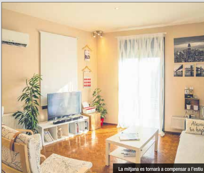
La mitjana es tornarà a compensar a l'estiu

preveiem que en el cas d'un consum anual de 2.750 kWh, que és la mitjana registrada pels usuaris de Barcelona Energia, afavorirem un estalvi de més de 230 euros a la factura de la llum", remarca Gallart. I és que, si es compleixen les previsions meteorològiques que auguren una primavera inusualment càlida i la possible arribada prematura de l'estiu, l'augment de la calor afectarà directament en l'ús de determinats electrodomèstics, especialment dels aparells de refrigeració i climatització. "L'any passat ja vam viure un dels estius més calorosos, amb una temperatura mitjana 1,3 graus superior a la mitjana habitual. Un context que, segons vam poder estimar en el consum dels usuaris de Barcelona Energia, va comportar un increment d'un 8%", recorda Lu Gallart. "Les onades de calor no tan sols estan sent cada cop més freqüents i intenses, sinó que enguany és probable que arribin més aviat. Això afectarà directament en el consum elèctric, en línia amb les tendències que vam veure l'any passat".