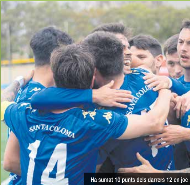
Ha sumat 10 punts dels darrers 12 en joc

La bona dinàmica colomenca segueix perllorant-se. Després dels triomfs a Peralada i contra la Montaña a casa, la Grama rebia la visita de la Pobla de Mafumet al Municipal. Un equip jove però amb les idees molt clares i que no posaria les coses fàcils als de Joan Este-