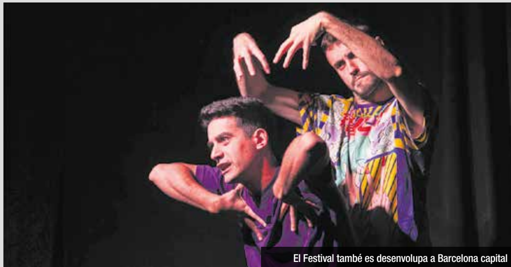
El Festival també es desenvolupa a Barcelona capital

ses obres de comèdia entre les que destaquen Lorca en Lorca de Mamut teatre (13 d'abril a la Sala Off); Síndria de la Companyia La Crispeta (14 d'abril a la Fabra i Coats); i Remanso de Paz de la Cía. Delinfame (12 d'abril a la