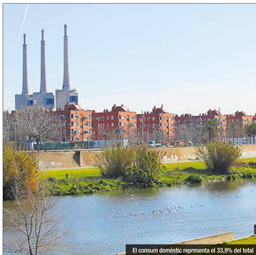
El consum domèstic representa el 33,9% del total

En l'any d'estudi (2022), s'estima que l'aigua del freàtic va aportar un 70,68% de la demanda d'aigua per al reg de zones verdes i neteja de carrers al municipi. En aquest sentit, l'estudi conclou que hi ha potencial per cobrir-la del tot, el que permetria reduir un 2,9% l'actual petjada hídrica territorial. Aprofitar aquesta aigua és clau per reduir-la o evitar la petjada hídrica de tercers.