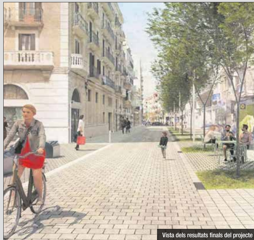
Vista dels resultats finals del projecte

També en qüestions urbanístiques, destacar que ja s'està elaborant el projecte inicial de remodelació integral de l'Av. de la Platja, iniciativa que donarà un salt de qualitat molt significatiu al barri de Sant Joan.