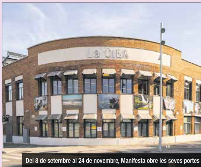
Del 8 de setembre al 24 de novembre, Manifesta obre les seves portes

Manifesta la Biennial Nòmada Europea, obrirà la seva quinzena edició del 8 de setembre al 24 de novembre del 2024. Reconeguda per la seva visió innovadora a l'hora d'indagar en qüestions globals urgents a través de la cultura, aquesta edició de Manifesta des-