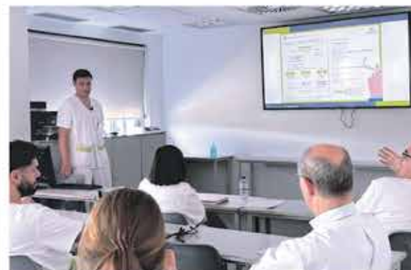
Presentació als professionals del Servei d'Urgències el nou protocol.

Des del Grup de Treball Hospital Sense Fum es vol promoure que els professionals del servei d'urgències de l'hospital incentivin als pacients ingressats fumadors a començar el tractament des del moment que entren a urgències, i no haver d'esperar a arribar a planta com s'havia fet fins al moment actual anticipant-se així per a evitar una síndrome d'abstinència durant l'ingrés.