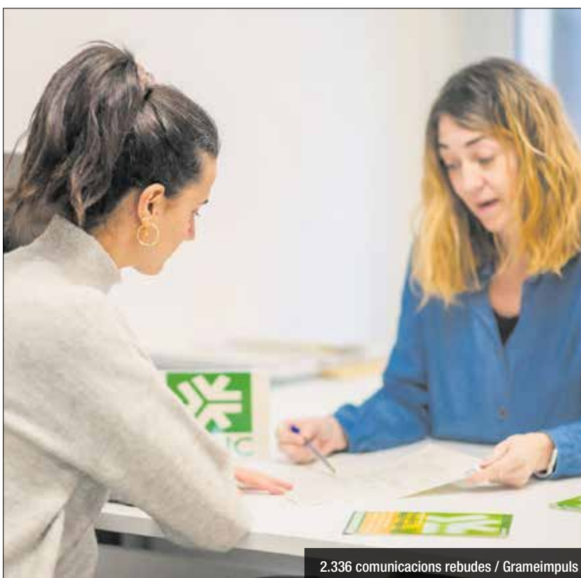
2.336 comunicacions rebudes / Grameimpuls

Un 70,47% de les peticions dels veïns es van respondre en un màxim de 45 dies