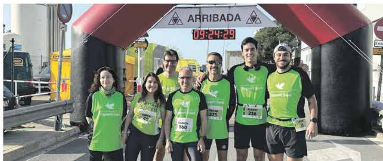
Els professionals de la FHES a la 29 a edició de la Cursa Atlètica de la Sanitat Catalana.

Com cada any, professionals de la Fundació Hospital de l'Esperit Sant han participat en la Cursa Atlètica de la Sanitat Catalana, organitzada de manera voluntària pels professionals de l'Hos-