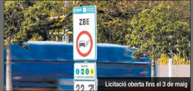
Licitació oberta fins el 3 de maig

L'Ajuntament de Santa Coloma de Gramenet licita les obres corresponents al projecte executiu d'implantació d'una zona de baixes emissions (ZBE) al mateix municipi mitjançant una xarxa de càmeres de lectura de matrícules, amb mesures de contractació socialment responsable. L'actuació s'emmarca dins del Pla de Recuperació, Transformació i Resiliència, finançat amb fons europeus Next Generation. El valor estimat del contracte és de 1.646.856,23 euros i es preveu una durada de 10 mesos. Els criteris