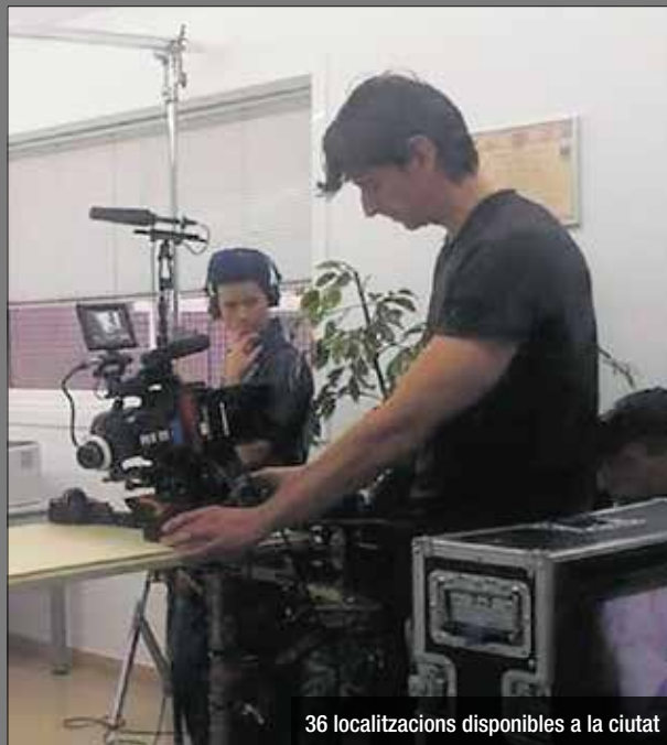
36 localitzacions disponibles a la ciutat

La seva proximitat amb Barcelona i una infraestructura adaptada per acollir grans produccions ha situat Santa Coloma dins el top10 de ciutats del país en xifra de rodat-