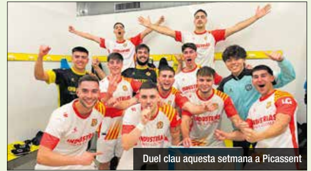
Duel clau aquesta setmana a Picassent