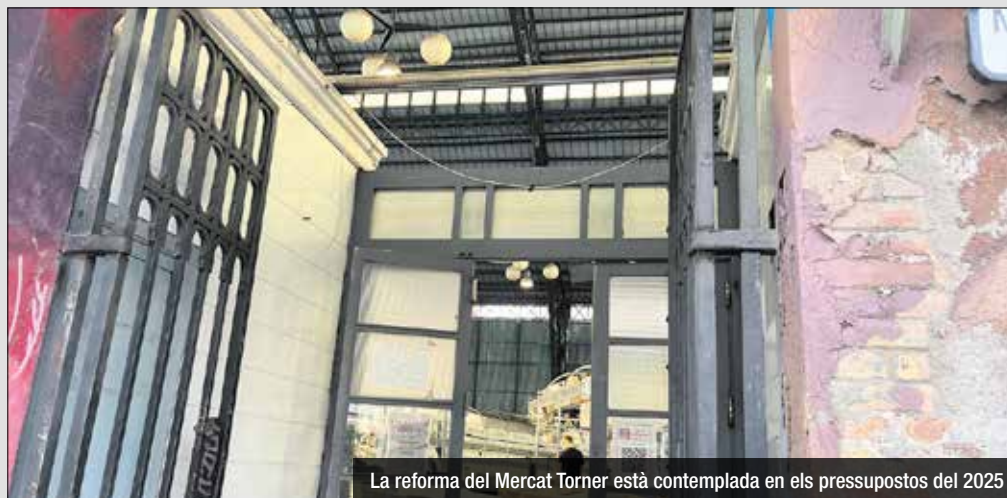
La reforma del Mercat Torner està contemplada en els pressupostos del 2025

Vint milions més de pressupost ordinari en el 2025 per a reforçar punts clau com la plantilla de personal i els manteniments. Però sense conèixer el grau d'execució del pressupost del 2024 i amb 290 milions d'euros a les arques municipals acumulats d'actuacions no realitzades, hi ha inquietud sobre si la maquinària municipal podrà tirar endavant amb tot.