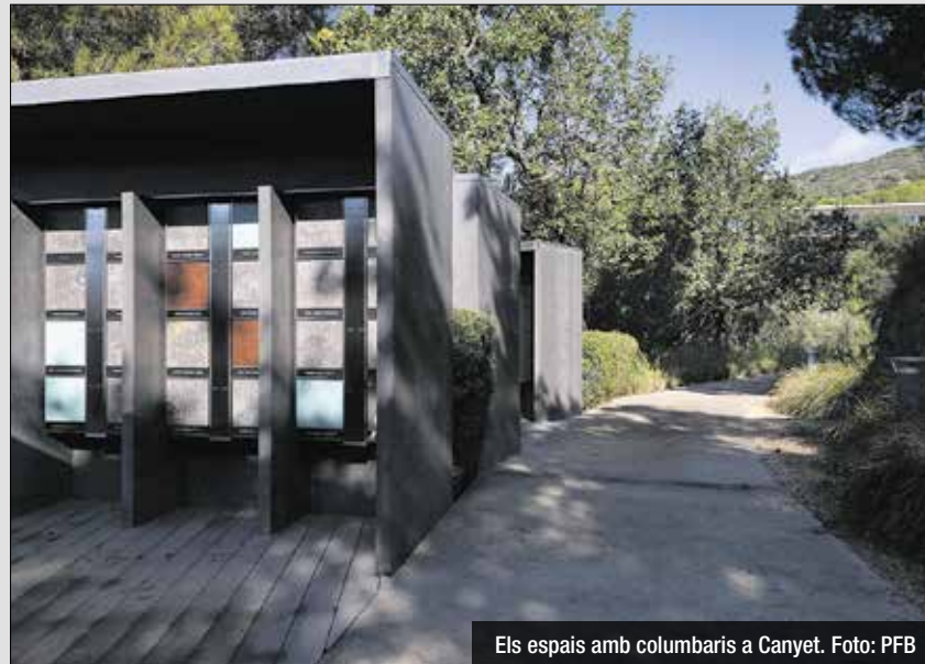
Els espais amb columbaris a Canyet.

Per aquests dies, hi ha activitats especials i ampliació d'horaris d'obertura de cementiris i espais de dol. Per segon any consecutiu es proposa l'acció de "L'arbre del record" perquè les persones que visitin del 25 d'octubre al 3 de novembre el Tanatori de Badalona puguin deixar missatges en memòria dels difunts. També en aquest període, l'espai del Jardí del repòs i del Camí del repòs restarà obert de les 8h a les 17h de la tarda. Acullen els cada cop més demanats columbaris per a urnes, memorial cineraris i des de fa unes