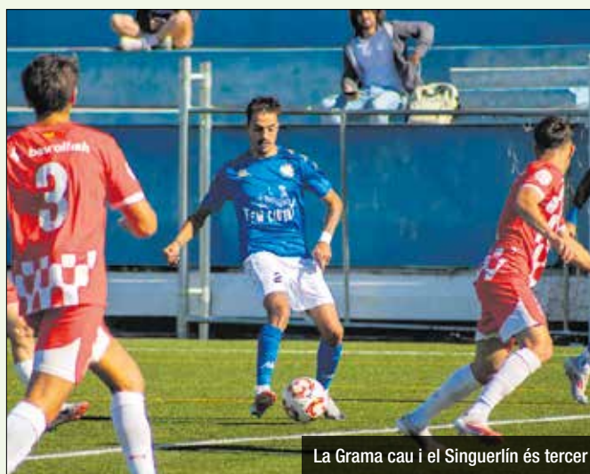
La Grama cau i el Singuerlín és tercer