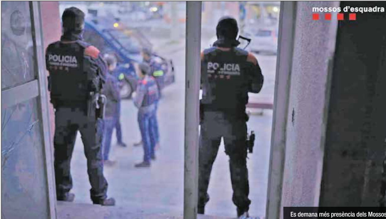
Es demana més presència dels Mossos

Després del tiroteig recent, succeït el passat 5 d'octubre