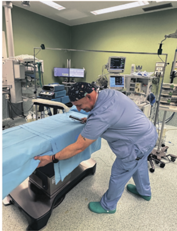
Professional de l'Hospital movent una de les noves taules quirúrgiques.