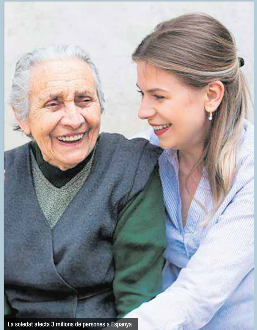
La soledat afecta 3 milions de persones a Espanya

El programa Sempre Acompanyats s'ha consolidat en 10 anys de trajectòria com a projecte pioner tant en l'abordatge de la soledat com en el model d'intervenció. Fins ara, aquest 2024 ja ha atès de manera personalitzada a un total de 2.203 persones grans a tot l'Estat, un 20 % més que