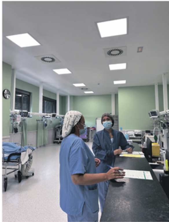
La nova il·luminària LED a la sala de reanimació.

La Fundació Hospital de l'Esperit Sant ha dut a terme diverses obres al Bloc Quirúrgic en els darrers mesos per avançar amb el procés de modernització d'aquest espai.