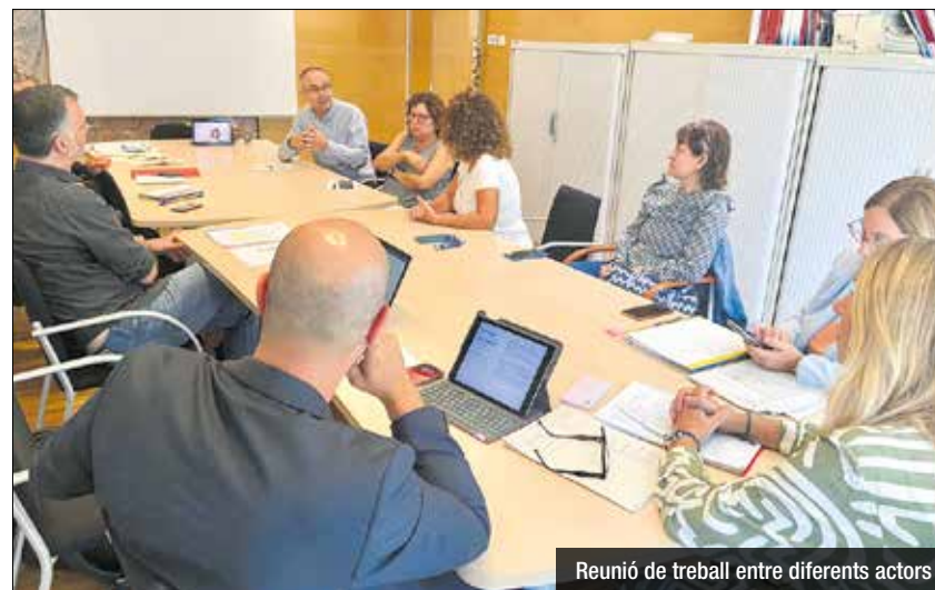
Reunió de treball entre diferents actors

per molts veïns, on la participació ciutadana serà clau per dissenyar polítiques eficaces. "La participació de la ciutadania és essencial per fer polítiques útils", han afirmat des de l'Ajuntament, subratllant la importància d'escoltar les necessitats i preocupacions dels residents. Amb aquest nou pas, Sant Adrià reafirma el seu compromís amb la millora de la qualitat de vida dels seus habitants, treballant de manera col·laborativa per trobar solucions a aquesta problemàtica ambiental.