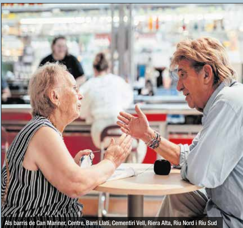
Als barris de Can Mariner, Centre, Barri Llatí, Cementiri Vell, Riera Alta, Riu Nord i Riu Sud

gestionar millor les situacions de soledat, milloren el seu estat d'ànim, incrementen la xarxa social i participen més en la comunitat. Actualment, el programa Sempre Acompanyats s'implementa a 13 territoris de tot l'Estat de la mà de 13 entitats a: Jerez, Múrcia, Pamplona, Granada, Màlaga, Palma, Sabadell, Terrassa, Tortosa, Girona, Tàrraga, Santa Coloma de Gramenet i Lleida. I també a Lisboa i Porto. El desenvolupament del programa és possible gràcies a la implicació d'entitats socials locals vinculades a la comunitat, més de 200 professionals i 300 persones voluntàries. En total, aquest any ha impulsat més de 400 activitats comunitàries complementàries que han arribat a més de 10.000 persones. La missió del programa Sempre Acompanyats és empoderar les persones grans en situació de soledat posant-les al centre, com a subjectes actius del seu propi procés d'envelliment, i acompanyant-les en la cerca d'una vida plena a partir del foment de les relacions de benestar i suport. Així mateix, el programa busca la implicació de la ciutadania i l'entorn comunitari per construir aliances i treballar en xarxa. L'objectiu és sensibilitzar la ciutadania i minimitzar les situacions de soledat de la gent gran. A més a més, en ocasió del desè aniversari, el programa impulsarà al novembre a Barcelona una jornada amb diversos experts per abordar la soledat des de diverses perspectives; també ha posat