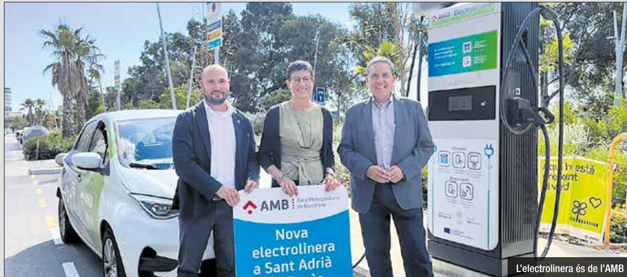
L'electrolinera és de l'AMB

Actualment, Sant Adrià compta amb diversos punts de càrrega per a vehicles elèctrics, que es poden trobar a diferents ubicacions estratègiques, com a l'Aparcament La Vila, situat a la Plaça de la Vila, 9, al Parking Platja, a l'Avinguda de la Platja, 2, i als carrers Ramon Llull i Tibidabo. L'obertura de l'electrolinera a la Rambleta reforça l'oferta de serveis per als usuaris de vehicles elèctrics, que ara disposen de més opcions per carregar els seus cotxes de manera còmoda dins del municipi.