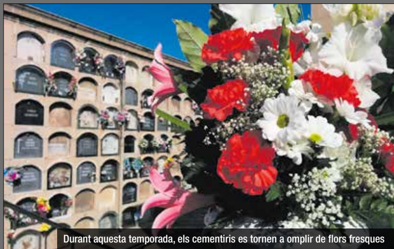
Durant aquesta temporada, els cementiris es tornen a omplir de flors fresques

Des del dissabte 26 d'octubre fins al diumenge 3 de novembre l'horari d'obertura dels dos cementiris, el de Sant Pere i el del Sant Crist, serà de les 8h del matí fins a les 18h de la tarda. A tots dos equipaments hi haurà un servei d'escales per a les persones que ho necessitin. Es recomana accedir-hi amb transport públic i per garantir un bon servei donada d'alta