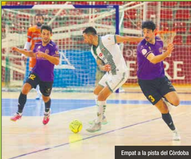
Empat a la pista del Còrdoba

Diumenge 17h al Pavelló Nou, el FC Barcelona visita Industrias Santa Coloma