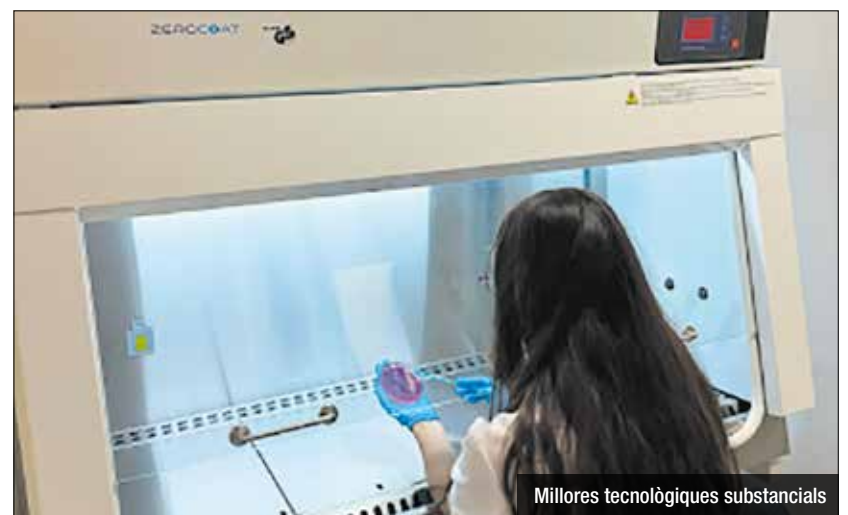
Milliores tecnològiques substancials

En les darreres setmanes l'Hospital ha dut a terme una sèrie de millores significatives al Servei de Laboratori amb l'objectiu de potenciar la qualitat i l'eficiència del seu servei. Entre les actuacions més destacades, s'inclou l'ampliació dels espais dedicats a la Microbiologia, on s'ha incorporat una nova campanya de protecció d'usuari i producte que obre la porta a l'ús de noves tècniques de diagnòstic. Aquesta nova tecnologia permet als professionals del laboratori realitzar processos amb una precisió i seguretat millorades, gràcies a un ambient controlat i estèril. A més, el projecte també ha contemplat la millora i condicionament de l'office destinat als professionals del laboratori. Aquest nou espai està dissenyat per facilitar el treball en equip i proporcionar un entorn de descans i col·laboració més adequat per al personal, contribuint així al seu benestar. Un altre aspecte rellevant de les millores és l'ampliació del magatzem del laboratori. Aquest nou espai permet una millor organització i gestió dels materials i reactius