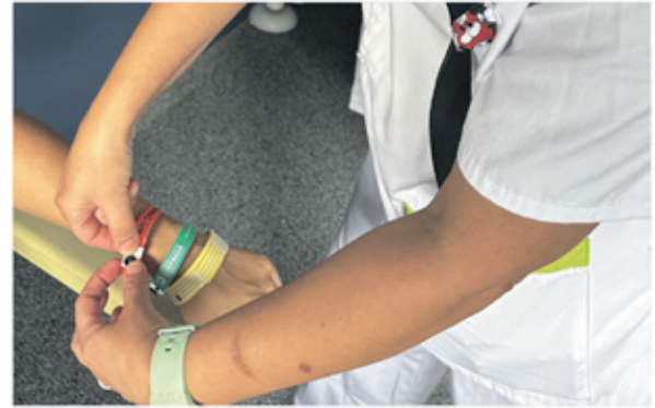
Una professional de l'Hospital col·locant les dues noves polseres a una pacient.

L'Hospital ha implementat dos nous models de polseres identificatives destinades a indicar situacions clíniques especials dels pacients. La polsera de color verd serà utilitzada per identificar aquells pacients que presenten disfàgia, mentre que la de color vermell/taronja indicarà si el pacient té risc de caigudes.