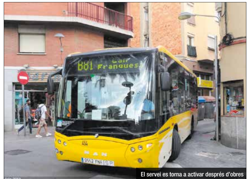
El servei es torna a activar després d'obres

va obrir al trànsit pel transport públic i es va normalitzar el servei de bus metropolità que dona cobertura als barris de Santa Rosa i Raval. La línia B-81 ha modificat el seu recorregut, des del c. Circumval·lació baixa per Sant Jordi fins a l'encreuament amb av Generalitat, i gira per aquesta avinguda per tornar a pujar pel c. Pau Claris i recuperar el seu recorregut habitual.