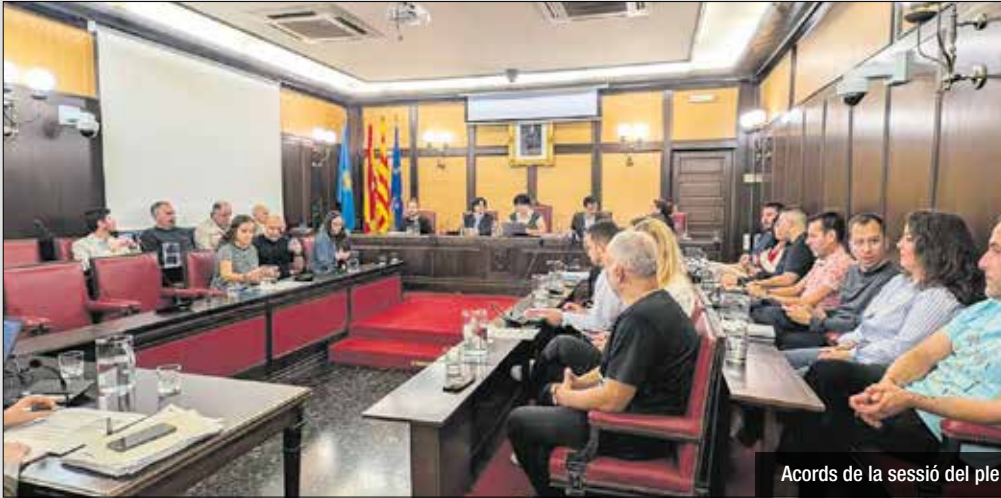
Acords de la sessió del ple

L'Ajuntament disposa actualment de 20 ordenances fiscals, 5 de preus públics i 1 ordenança de prestacions patrimonials. Com a norma general, es congelen pràcticament tots els impostos. Pel que fa als que s'ajusten, l'IBI augmenta per sota de la inflació interanual i s'apuja un 2%, amb una