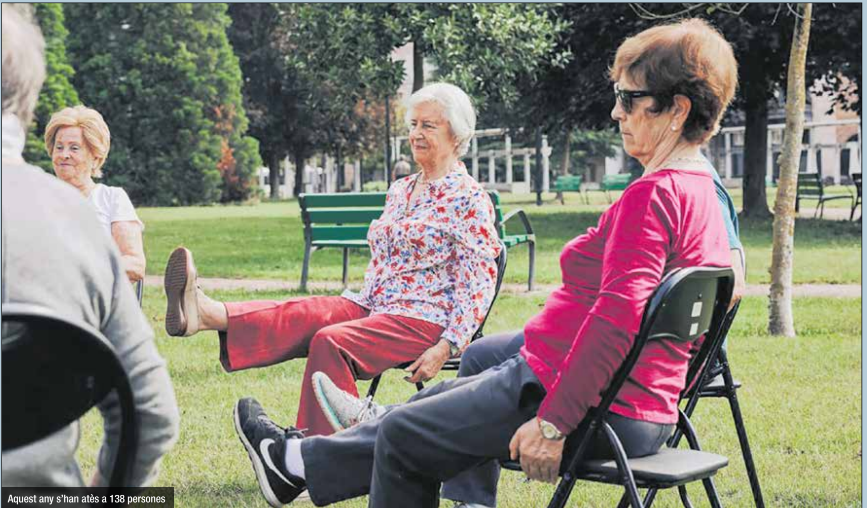
Aquest any s'han atès a 138 persones

en marxa el postgrau en Soledat, Relacions i Vida Plena a la Universitat de Vic.