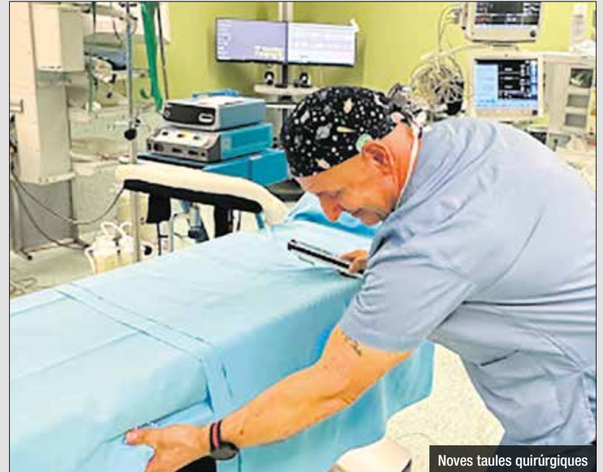
Noves taules quirúrgiques

El bloc quirúrgic de la Fundació Hospital de l'Esperit Sant (FHES) ha incorporat dues noves taules quirúrgiques d'última generació amb l'objectiu de millorar la seguretat del pacient i optimitzar el treball dels equips mèdics durant les intervencions. Aquestes noves taules, instal·lades als quiròfans 1 i 3, estan dissenyades amb una tecnologia molt avançada amb sistemes automatitzats, oferint una major versatilitat i adaptabilitat per a diferents tipus de cirurgies, i això permet una millor col·locació del pacient i contribuint a una reducció dels temps quirúrgics, a més de millorar les condicions ergonòmiques per al personal mèdic. Amb aquesta millora tecnològica, la FHES reforça el seu compromís amb la qualitat assistencial i la seguretat del pacient, posant a disposició de l'equip quirúrgic eines capdavanteres per oferir una atenció excel·lent. La implementació de les noves taules qui-