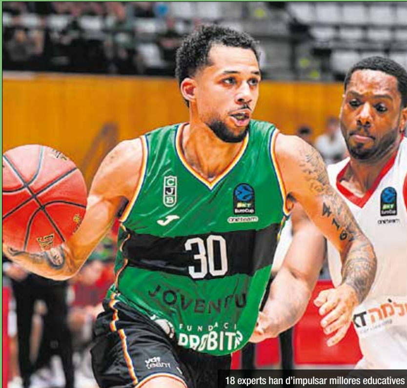
18 experts han d'impulsar millores educatives

Baskonia, Gran Canària (Eurocup) i Bàsquet Girona són els pròxims partits per als verd-i-negres, obligats a reaccionar a la Lliga Endesa