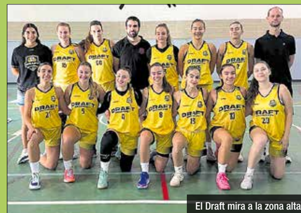
El Draft mira a la zona alta

El CB Santa Coloma talla una ratxa de tres derrotes consecutives a Copa Catalunya. Victòria vermella a la pista del Llefià (72-75). Partit molt controlat pels vermells, tot i que al final el marcador es va ajustar.