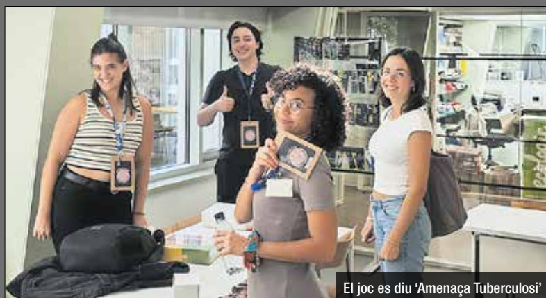
El joc es diu 'Amenaça Tuberculosi'

La Unitat de Tuberculosi Experimental de l'Institut de Recerca Germans Trias i Pujol (IGTP) va presentar en exclusiva un innovador joc de taula cooperatiu sobre la tuberculosi, anomenat "Amenaça Tuberculosi", en un taller celebrat a la Biblioteca Montbau-Albert Pérez Baró, de Barcelona. El joc, creat per cinc investigadors de la Unitat - Mariona Cor-