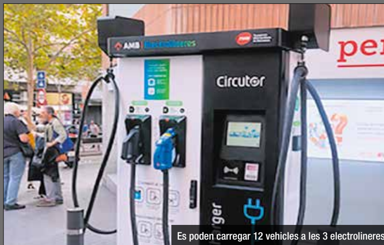
Es poden carregar 12 vehicles a les 3 electrolineres

Santa Coloma compta amb una nova electrolinera al carrer Sagarra, 16. Un punt de recàrrega ràpida de vehicles elèctrics que se suma als de l'avinguda Pallaresa, 86, i passeig Salzereda, 67, que ja donen servei a la ciutadania des d'abans de l'estiu. Aquesta electrolinera, que ja està operativa, forma part del programa MetroCHARGE d'aprofitament