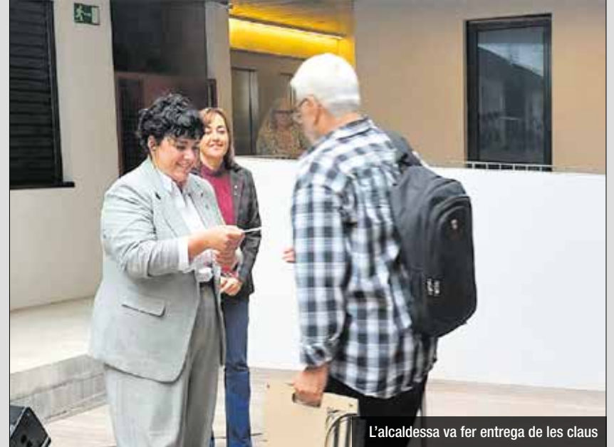
L'alcaldessa va fer entrega de les claus

El nou edifici d'obra nova, sostenible i eficient energèticament, disposa de serveis comunitaris i aparcament propi, amb una plaça d'aparcament per habitatge. De fet, aquest nou edifici s'inclou com a prova pilot en el projecte europeu SYN.IKIA per desenvolupar edificis de balanç energètic positiu (PEB Plus Energy Buildings), amb sistemes de disseny per reduir la demanda energètica i una instal·lació centrada de producció d'electricitat amb plaques fotovoltaïques. L'edifici genera l'energia necessària per als seus espais comuns i també per al Centre d'Assistència Primària (CAP Fondo), esdevenint una comunitat energètica. Per poder participar en processos d'adjudicació com aquest les persones interessades