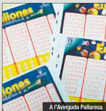
A l'Avinguda Pallaresa

El sorteig d'Euromillones del passat divendres 11 d'octubre de 2024 no va deixar encertants de primera categoria (cinc números i dues estrelles). El bitllet encertant d'El Millón ha estat validat a l'administració de loteries 5 de Santa Coloma de Gramenet (Barcelona), situada a l'Avinguda Pallaresa, 90. El premi és d'un milió d'euros. El premi de 223.088,05 euros va ser validat a l'administració de loteries 2 de La Roda (Albacete).