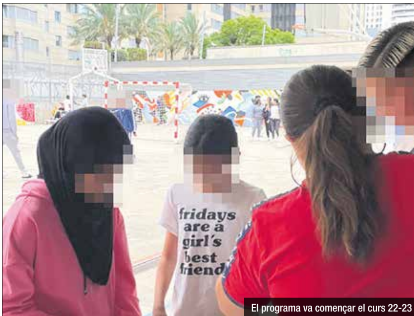
El programa va començar el curs 22-23