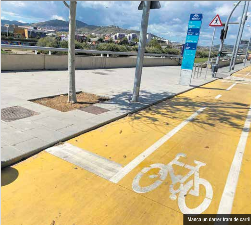
Manca un darrer tram de carril

Ha format més de 50.000 alumnes i s'ha consolidat com una acadèmia de referència