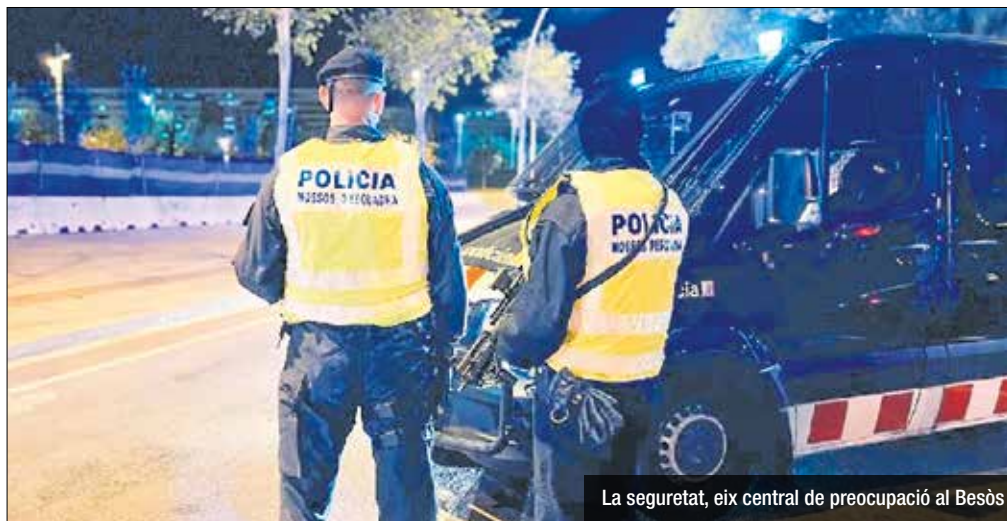
La seguretat, eix central de preocupació al Besòs

La proposta pactada per Junts i el PSC rep el suport de quasi tots els grups