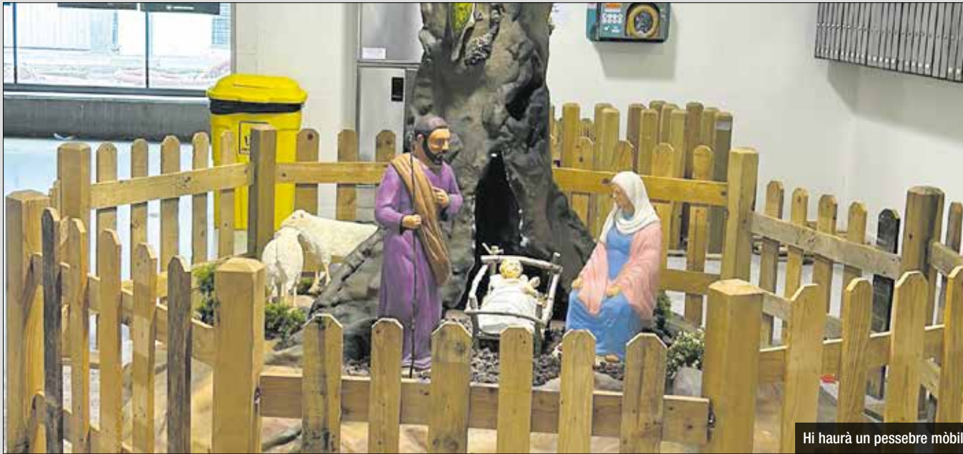
Hi haurà un pessebre mòbil

Els mercats de Sant Adrià de Besòs es preparen per viure un Nadal ple d'activitats per a totes les edats. Des del Mercat d'abastaments fins al mercat ambulant, s'han organitzat diverses iniciatives per celebrar aquestes dates amb alegria i tradició.