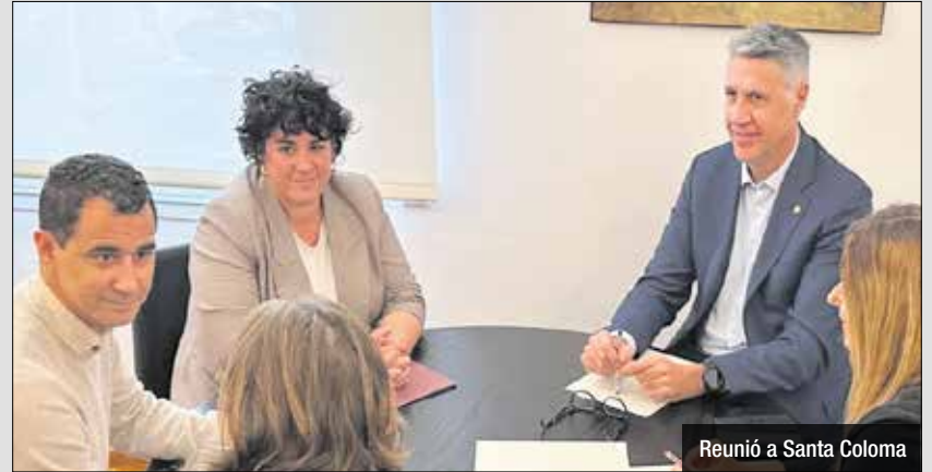
Reunió a Santa Coloma