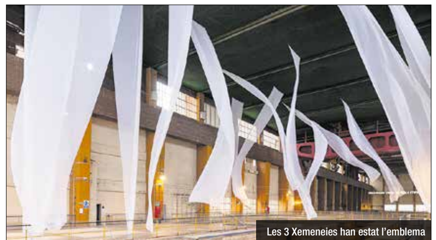
Les 3 Xemeneies han estat l'emblema

La biennial nòmada d'art Manifesta 15 Barcelona Metropolitana, celebrada entre el 8 de setembre i el 24 de novembre, ha comptabilitzat un total de 291.336 visites repartides entre les seves 16 seus situades a 12 municipis de l'àrea metropolitana de Barcelona, segons ha informat l'organització en un comunicat. El programa d'aquesta edició de Manifesta 15 ha inclòs espais emblemàtics com la Casa Gomis del Prat de Llobregat, les Tres Xemeneies i l'antic edifici de l'Editorial Gustavo Gili.