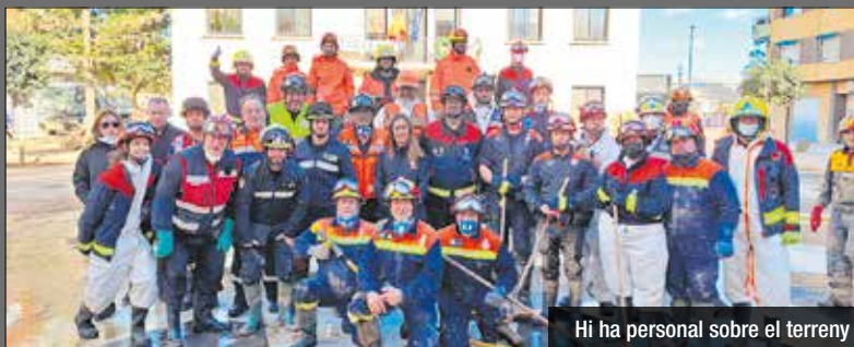
Hi ha personal sobre el terreny

Un mes després de les devastadores pluges provocades per la DANA que van afectar greument la Comunitat Valenciana, els voluntaris de Protecció Civil de Sant Adrià de Besòs continuen treballant per ajudar els municipis més damnificats. La tasca dels voluntaris ha estat essencial per contribuir a la neteja i reconstrucció de localitats com Paiporta, Picanya i Alfarb, on encara es perceben els efectes de la tragèdia. Un equip format per vuit voluntaris de Protecció Civil adrianaenca s'ha desplaçat a la zona per unir esforços amb altres associacions i equips de