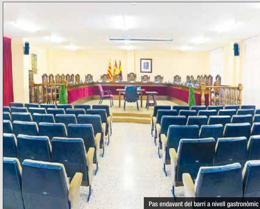
Pas endavant del barri a nivell gastronòmic

Pel que fa als ingressos, es redueix la previsió dels impostos directes i indirectes en un 28% respecte a l'exercici anterior. També hi ha increments importants de les transferències corrents (11% respecte al 2024) i dels ingressos de l'Estat (14% respecte al 2024). Ferrer va fer esment durant el ple de «la fortalesa econòmica del nostre ajuntament, que un any més no tindrà deute, garantint així l'estabilitat a