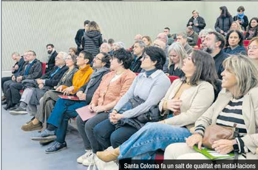
Santa Coloma fa un salt de qualitat en instal·lacions