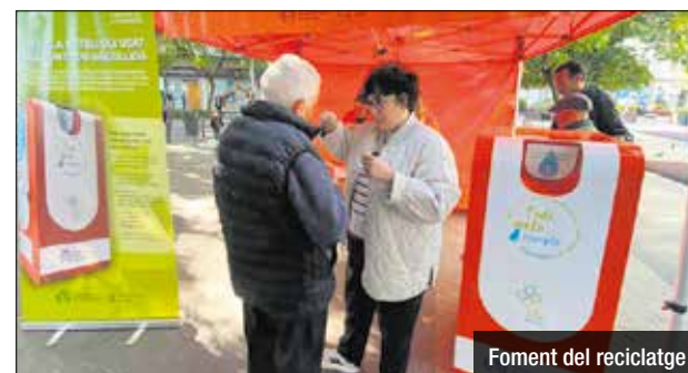
Foment del reciclatge

ens recorda que Santa Coloma ja disposa d'una trentena de punts de recollida d'oli distribuïts per tots els barris, on es troben contenidors especials per dipositar l'oli domèstic utilitzat -d'oliva, girasol...o provinent de les conserves-. La ciutadania hi ha de deixar l'oli en ampolles tancades -preferentment de plàstic-, i per facilitar encara més aquest procés de recollida a les llars colomenques i agilitzar l'emmagatzematge de l'oli, es repartiran 3.000 embuts reutilitzables per omplir les ampolles.