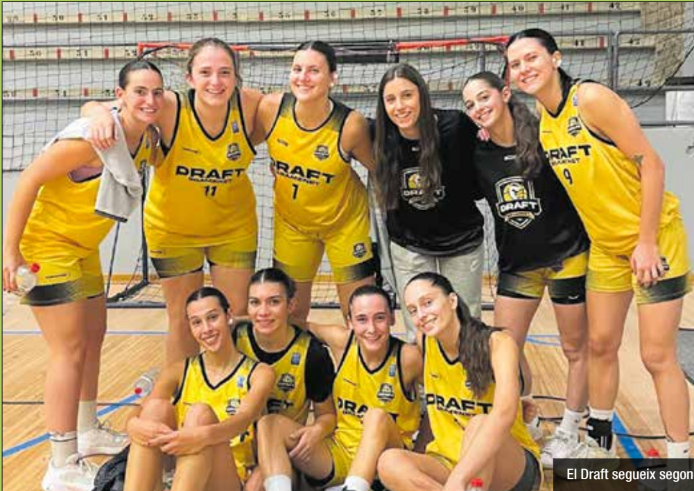
El Draft segueix segon

El conjunt colomenc supera un rival directe i encadena ja set triomfs seguits