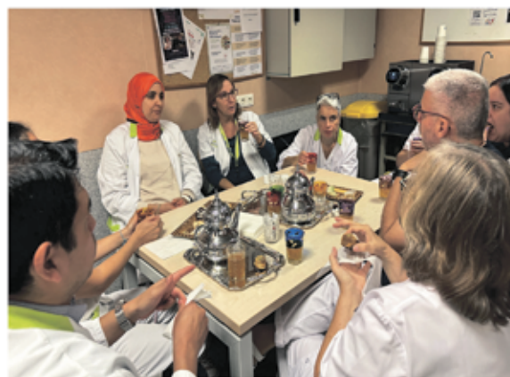
Un grup de professionals de la FHES amb la mediatra àrab.

La iniciativa va comptar amb l'ajuda dels professionals de Mediació Intercultural que col·laboren amb l'Hospital i es van posar a disposició dels nostres professionals per resoldre dubtes i oferir orientació als professionals.