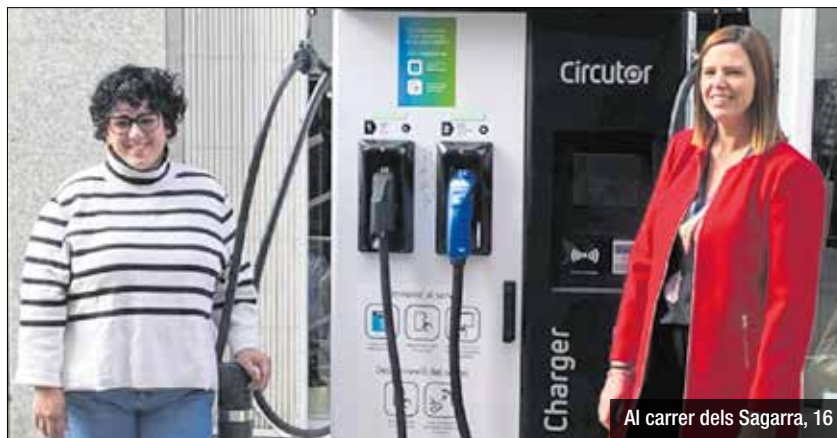
Al carrer dels Sagarra, 16

la via pública a la ciutat, els altres 3 estan ubicats a l'avinguda de la Pallaresa, 86-88; al passeig de la Salzereda amb carrer de la Cultura; i a l'avinguda dels Banús. Amb aquesta funció, s'han d'afegir-hi els punts de recàrrega ubicats als parquings municipals que gestiona Gramepark. «Les electrolinereres s'incorporen a les mesures municipals per fomentar una mobilitat saludable, com la reducció del 75% de l'impost de circulació per a vehicles elèctrics o el descompte que tenen aquests tipus de vehicles a les zones d'aparcament de l'espai públic», va explicar l'alcaldessa Mireia González.