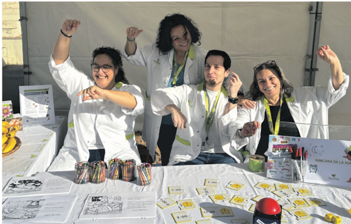
Professionals de la FHES i membres del Grup ProSomniM a la fira Ravaleando.

El passat mes de novembre, l'Hospital va participar en una nova edició de Ravaleando, una fira comunitària celebrada al barri del Raval de Santa Coloma de Gramenet.