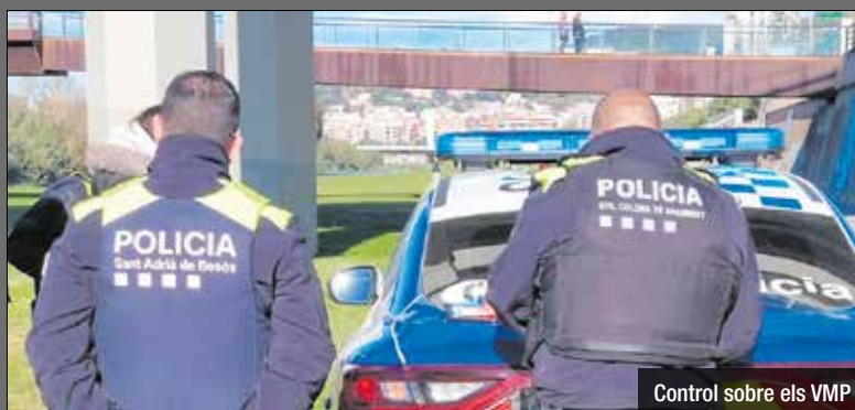
Control sobre els VMP

Agents de la Policia Local de Sant Adrià de Besòs i de Santa Coloma de Gramenet han dut a terme un dispositiu conjunt a la llera del riu Besòs amb l'objectiu de vetllar pel compliment de les normes de circulació dels vehicles de mobilitat personal (VMP) i garantir la seguretat de tots els usuaris i usuàries del parc fluvial. Durant el dispositiu, s'han inspeccionat diversos patinets i bicicletes per assegurar que compleixin amb la normativa vigent. En aquest marc, s'ha procedit a la retirada d'un patinet que