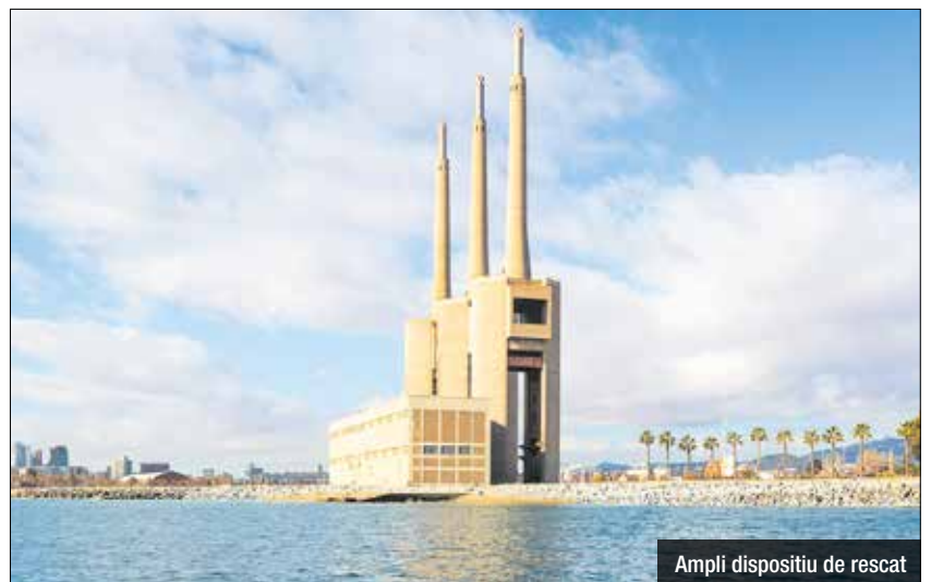
Ampli dispositiu de rescat

deriva en una situació de risc. El rescat va ser possible gràcies a un operatiu coordinat que va aconseguir localitzar el surfista i traslladar-lo fins al port del Fòrum en una llanxa de Salvament Marítim. Un cop al port, un metge va examinar l'afectat i li va donar l'alta mèdica sense necessitat de traslladar-lo a un centre sanitari. En l'operació de rescat van participar els Bombers de la Generalitat de Catalunya i Salvament Marítim, amb la col·laboració dels Mossos d'Esquadra, Bombers i la Policia Local de Sant Adrià.