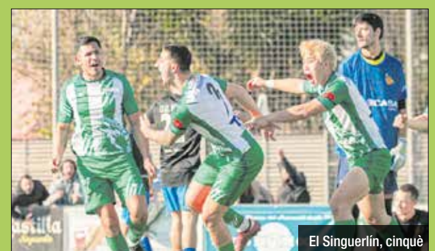
El Singuerlín, cinquè

tacable registre defensiu, ja que només han rebut un gol en aquests sis partits. Aquest triomf consolida el Singuerlín com la revelació de la Primera Catalana. El bloc colomenc es manté en la cinquena posició amb 20 punts i confirma una temporada espectacular fins ara. El conjunt de Santa Coloma es prepara ara per afrontar el seu darrer partit oficial de l'any 2024, on visitarà el Racing Vallbona la setmana vinent amb l'objectiu de tancar l'any amb un nou triomf i seguir escalant posicions a la classificació.