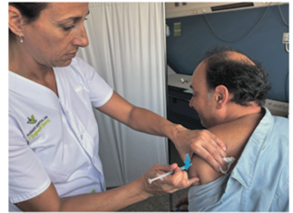
Un professional de la FHES vacunant-se de la covid.

Durant la campanya de vacunació de la grip i la dosi de record contra la Covid-19 del 2024, més de 290 professionals de la Fundació Hospital de l'Esperit Sant es van vacunar.