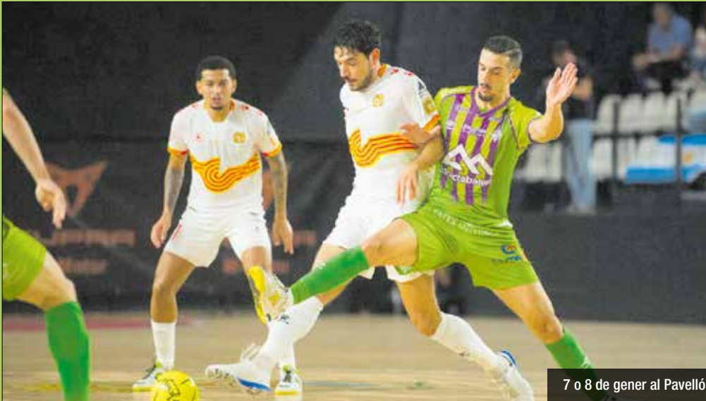
7 o 8 de gener al Pavelló

L'eliminatòria a partit únic es disputarà el 7 o 8 de gener en el Pavelló Nou