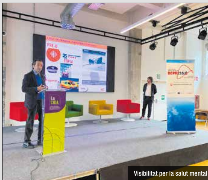
Visibilitat per la salut mental

Santa Coloma de Gramenet ha estat escollida com a ciutat pionera a Espanya per implementar aquest programa internacional innovador de prevenció del suïcidi, i reducció de la depressió i el malestar emocional. S'ha fet a La CIBA la jornada inaugural de MENTBEST: Santa Coloma Aliada Contra La Depressió, que marca l'inici d'un projecte europeu de dos anys durant el qual es duran a terme diverses activitats a Santa Coloma en col·laboració amb l'ajuntament, entitats locals i serveis de salut. L'objectiu és fomentar que la comunitat parli més i millor sobre salut mental, amb especial atenció a la depressió. A través de campanyes de sensibilització, tallers de formació, distribució de material psicoeducatiu, diversos esdeveniments de conscienciació i eines digitals. MENTBEST arriba per consolidar-se i adaptar-se al teixit associatiu sòlid i les múltiples iniciatives ja existents a la ciutat. La preparació del projecte es va engegar fa mesos amb el suport