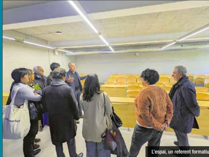
L'espai, un referent formatiu