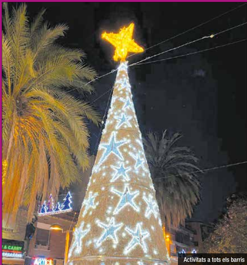
Activitats a tots els barris

S'han instal·lat més de 900 punts lluminosos a tota la ciutat amb LEDs de baix consum